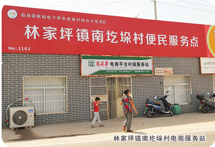
林家坪镇南圪垛村电商服务站

脱贫业务,实地走访贫困县超100个。过去一年,在阿里巴巴中国零售平台上,贫困县农产品销售额快速增长,同比增长34%。全国有82个贫困县农产品销售额超过1000万元。今年10月17日,是全国第五个“扶贫日”。根据销售额数据,阿里研究院向全球发布“2017—2018年全国贫困县农产品电商50强”排行榜,前三位是云南文山市、安徽舒城县和云南勐海县,第四至第十位依次为湖南平江县、江西寻乌县、西藏拉萨城关区、河北张家口万全区、山西临县、陕西富平县和江西广昌县。文/图 刘建荣