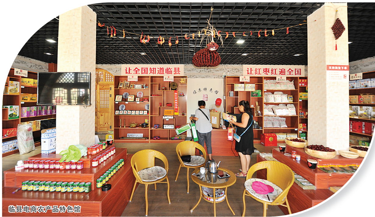
临县电商农产品特色馆