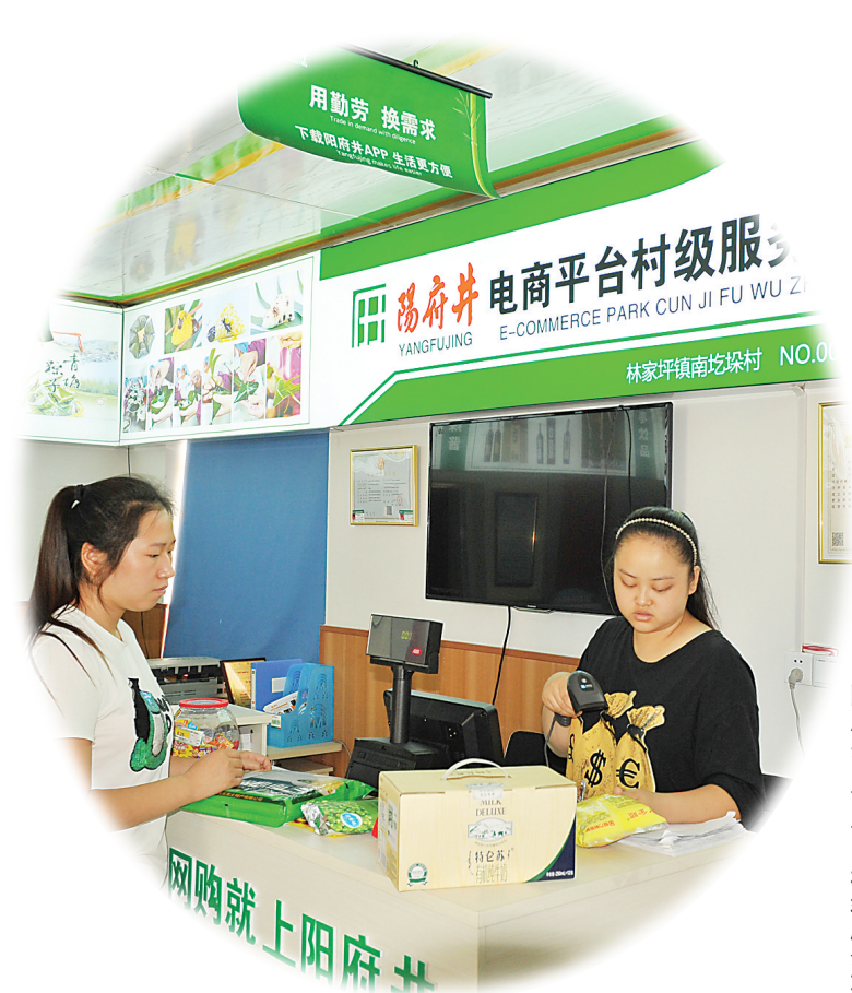
阳府井电商平台村级服务站