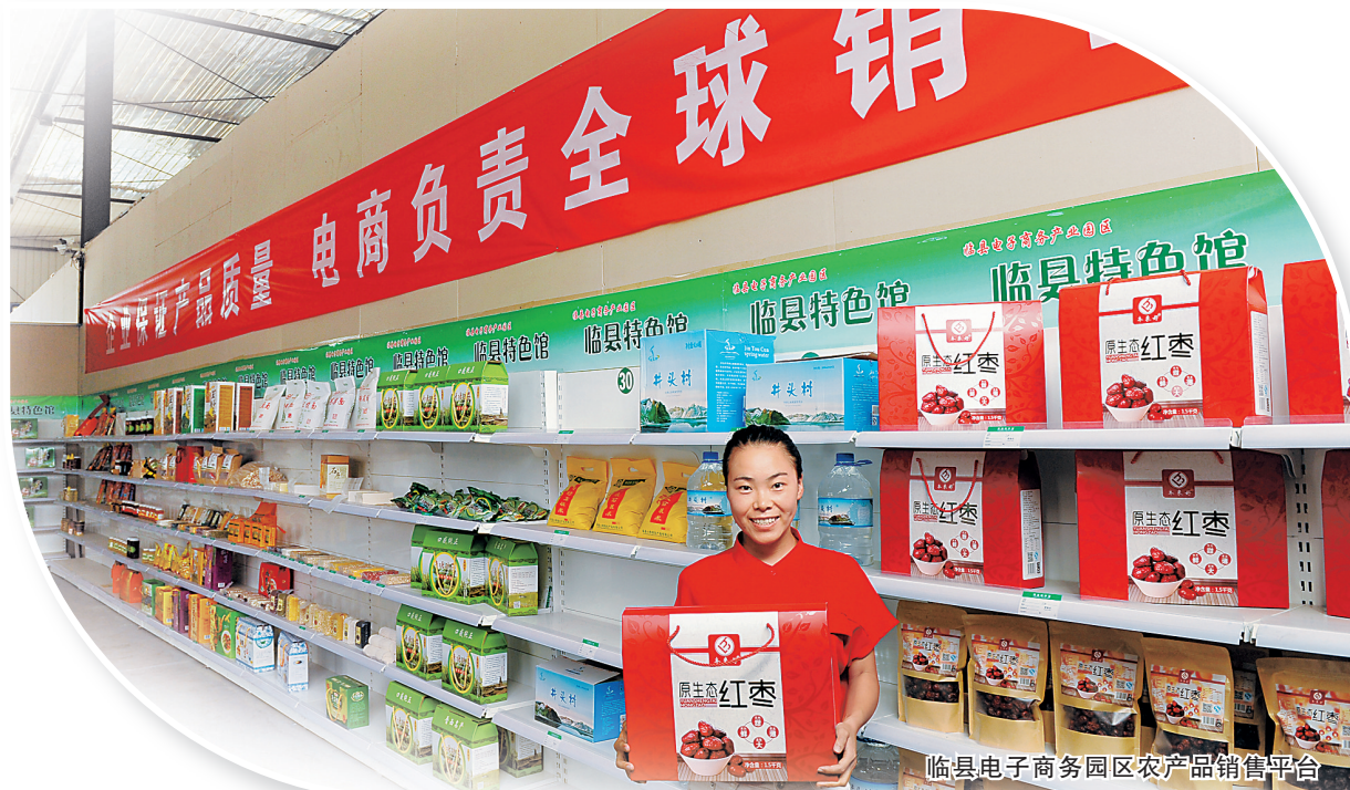
临县电子商务园区农产品销售平台