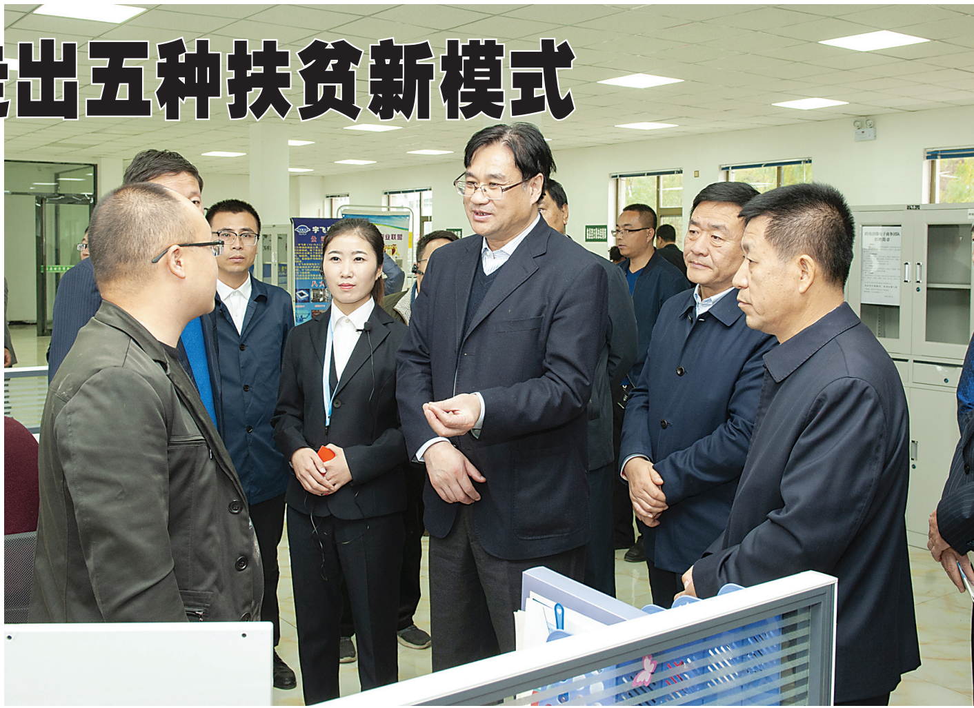
全国科技助力精准扶贫现场会在吕梁召开,与会人员在临县电子商务园区观摩