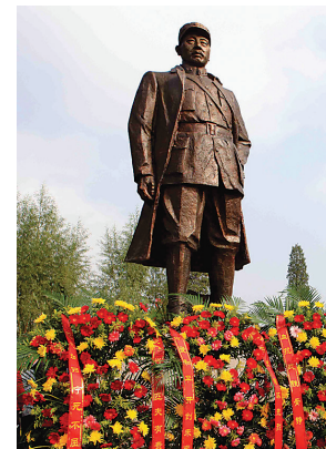
2015年9月23日,武士敏铜雕在河北省怀安县柴沟堡镇落成揭幕。

新华社石家庄2018年12月29日电(记者白林)河北省张家口市怀安县柴沟堡镇中心花园的中央,矗立着一尊高大的青铜雕像,铜像身披戎装,一手叉腰凝望前方。