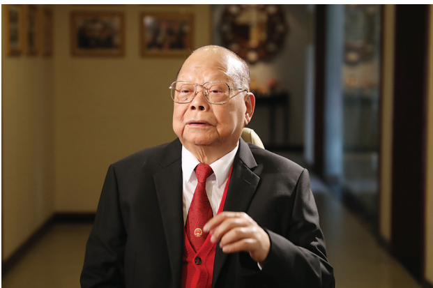
曾宪梓在接受采访(2018年12月14日摄)。

新华社香港2018年12月24日电(记者王旭 李滨彬)面前的电视屏幕上,是庆祝改革开放40周年大会庄严的会场。注视着屏幕的老人,端坐