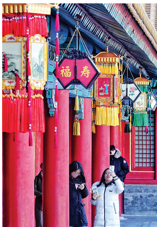
1月8日,故宫内悬挂宫灯营造节日气氛。当日,故宫博物院“贺岁迎春——紫禁城过大年”展览正式向观众开放,展览将持续至4月7日。

跟踪服务保权益出台《岚县“吕梁山”护工培训就业扶贫工作激励补助办法》《外出务工人员技能提升奖补办法》等惠民政策,鼓励农村劳动力外出务工,务工总收入达到5000元、10000元的农户,分别奖补200元、500元,激励群众解放思想、外出务工,增加工资性收入。据不完全统计,通过奖补政策激励,全县3.3万人提升技能实现就业,务工总收入达到3.5亿元。同时,在太原、离石等岚县务工人员集中地方引导成立岚县农民工协会,派驻专人为协会提供劳动合同、劳务权益等方面的法律政策咨询服务,确保外出务工人员合法权益不受侵害。(马建生 李娟)