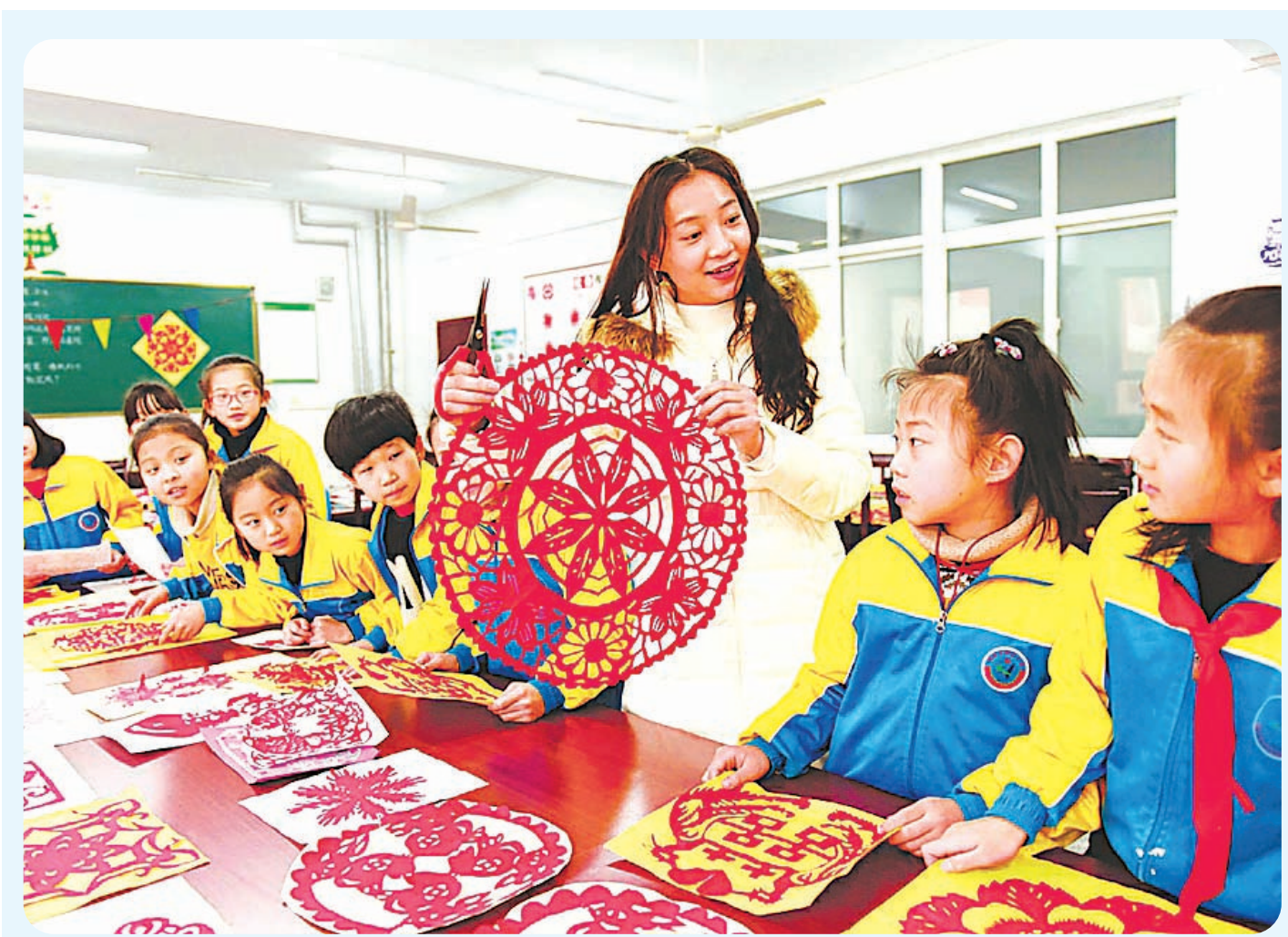
1月22日,南和县新区小学老师在指导学生进行学习剪纸。近年来,河北省南和县新区小学以社团活动为平台,积极开展内容丰富、形式多样的“第二课堂”特色教育,丰富校园文化生活。

做好消费“蛋糕”,需要多方发力。为此,中央经济工作会议在提升产品质量、改善消费环境、增强消费能力等方面作出重要部署。继续落实好个税专项附加扣除政策,让百姓钱袋子“鼓起来”;打破供给短缺现状,加快服务业等领域市场开放,以供供给侧结构性改革推进产品和服务升级,让百姓真正买得起、买得到、买得好,才是做大做好消费“蛋糕”的真谛。