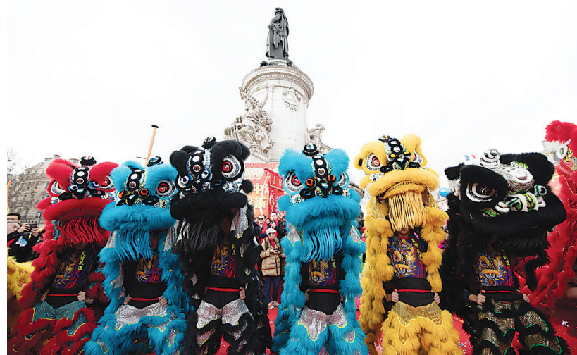
2月10日,在法国巴黎,演员在活动现场进行舞狮表演。当日,法法侨团在法国巴黎共和国广场举行活动庆祝中国农历新年。