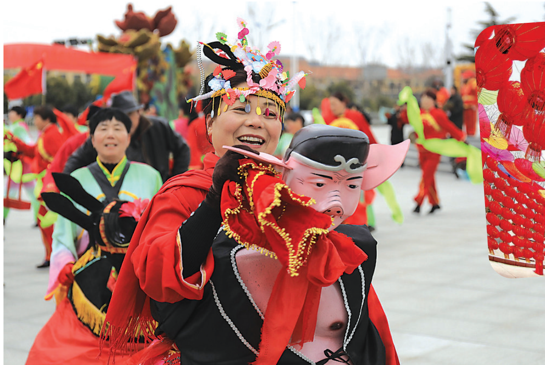
2月8日,游客在河北省秦皇岛市海港区秦皇求仙入海处景区庙会观光游玩。

1942年6月9日清晨,他驾驶一架双翼战斗机升向3000米高空,开始了高难度飞行训练。平时,他对飞行技术精益求精,严格要求自己,从不马虎。这天,当他做完大坡度盘旋急转弯之后,开始翻滚表演,第一次做得不够理想,于是又进行了第二次特技训练。突然发生意外,飞机旋转速度出现了异常,刹那间飞机由翻滚变成了螺旋下降。为了保住飞机,汪德祥放弃了跳伞逃生的机会,以身殉职,年仅26岁。