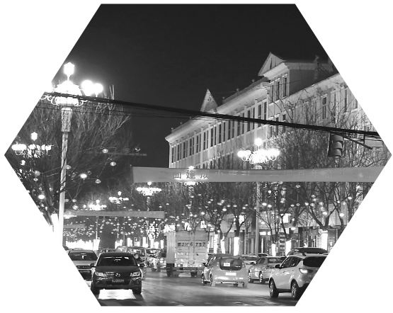
春节期间,方山县主街道、广场、公园等安装的迎“两节”彩灯全部亮了起来,整个县城就像灯的海洋。