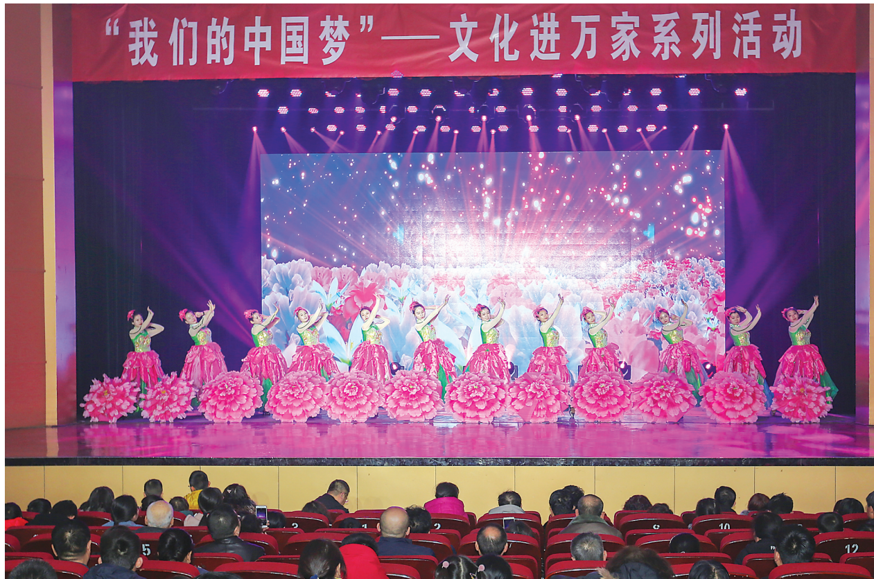
“我们的中国梦”——文化进万家系列活动