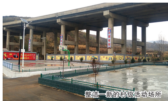
整洁一新的村级活动场所