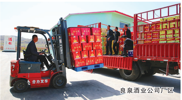
良泉酒业公司厂区