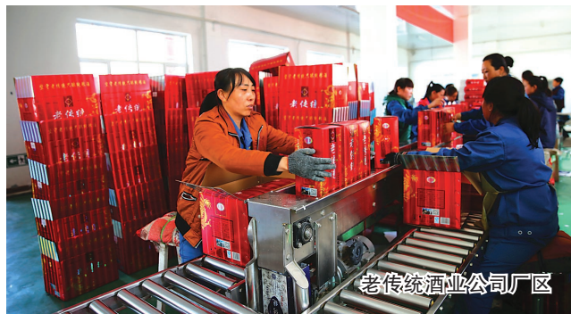
老传统酒业公司厂区