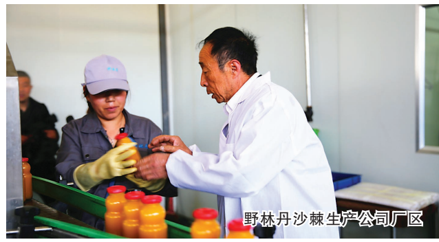
野林丹沙棘生产公司厂区