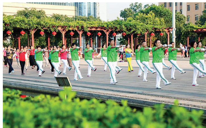
人们在广场舞动着轻盈的脚步

四十年,孝义这座城市已经从一个小城变得四通八达、高楼林立。拔地而起的高楼中,一座座廉租房、公租房、安置房为城市平添了许多温暖,老旧小区改造、棚户区改造使城市旧貌换新颜,从狭窄蜗居到“现代社区”,40年惠及全市人民的住房改革,印证了一个道理:那就是改革为了人民,改革依靠人民,改革成果让人民共享。40年改革开放,岁月峥嵘,40年世事变迁,波澜壮阔。从无到有、从弱到强,以实现高质量的生活水平为准则,人们充分享受到党的惠民政策带来的利好。回眸过去,展望未来,相信,孝义人民群众收到的民生礼包会更加丰富!