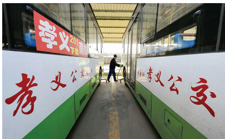
纯电动公交覆盖城乡