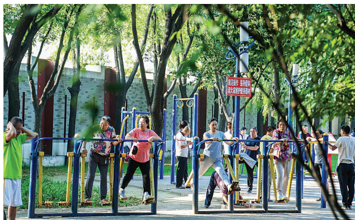
经常性参加锻炼人口逐年增加