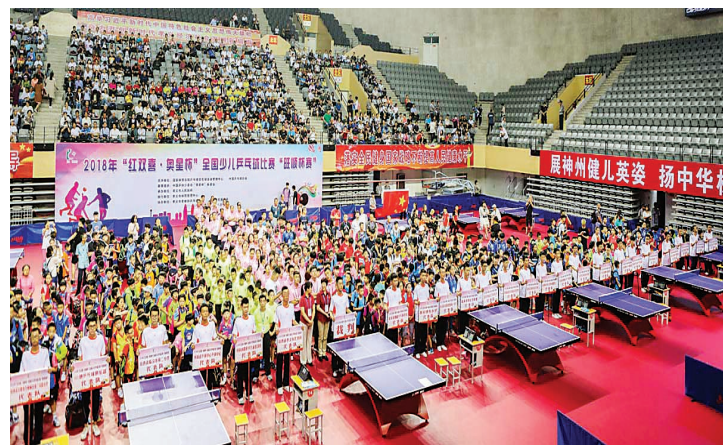
经常承办全国体育赛事