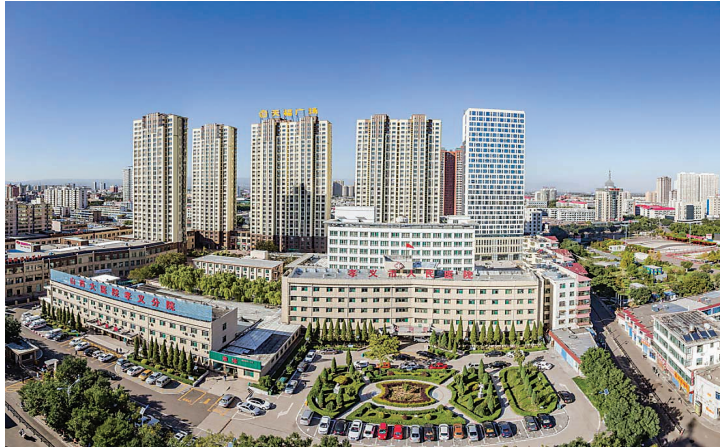
山西大医院孝义分院