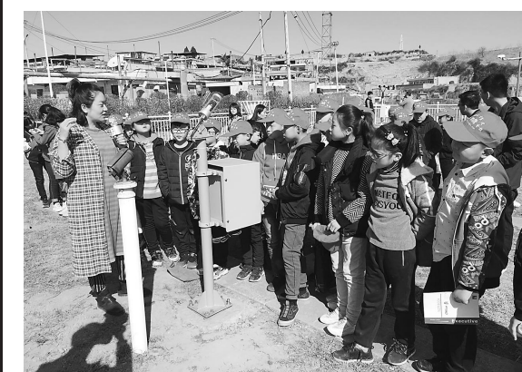
为切实做好2019年世界气象日宣传活动,柳林县气象局围绕“太阳、地球和天气”的主题开展了形式多样的宣传活动。图为“快乐作文”小学生走进气象观测站参观学习,业务人员带领小学生实地参观了观测场内气象仪器和人影火箭发射装置,并详细介绍了各类仪器的观测原理。

“高共享、低密度”的绿色创业环境,加上充满个性的各类创意元素,成功搭建了产生创意、大胆创新的平台,“胜溪创领”创客空间像磁石一样吸引着莘莘学子和青年创业者们。他们“拎包入住”,借助于胜溪创领提供的创业教育、拓展实训、导师对接等“一站式”服务,实现创业梦的同时也提升了孝义地域产业的内涵,服务着地方经济社会发展。在全面深化改革的征途上,推进大众创业、万众创新,是发展的动力之源,也是富民的根本之道和公平之计,广阔前景值得期待。