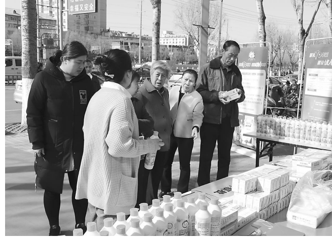
近日,山西同仁康大药房携手广州白云山和记黄浦中药有限公司在离石新华社区服务站举行“献礼七十华诞,再造健康中国”为主题的家庭过期药品回收公益活动,此举受到市民的一致好评。 图为市民积极参加家庭过期药品回收公益活动。

大力推动众创空间等创业孵化基地建设,为青年创业创新搭建交流平台,在青年创业过程中进行创业指导,沟通交流创业经验。启动“创客青春”创业创新大赛,帮助创业者寻找合作伙伴和创业投资人,为青年创业创新提供更广阔的空间。在当前脱贫攻坚浪潮中,要以市委“三个一”扶贫行动和“十项重点工程”为切入点,深入推进“青春扶贫行动”、农村青年创业致富“领头雁”培养计划,培养扶持一批青年产业脱贫带头人,带动农村青年率先脱贫。通过解决创业就业技术难题和人才难题,通过建设信息服务、创业赛会和综合服务平台,为贫困地区创业青年提供一站式服务。