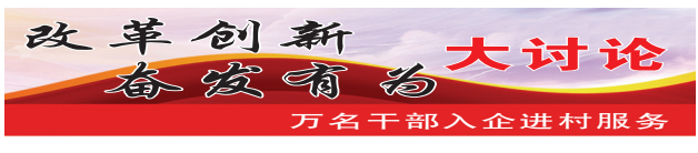
改革创新 大讨论 万名干部入企进村服务

其余29个问题在现场会上也进行了分类梳理,面对面解决。关于电力的问题,电力部门要做好政策宣传,提倡企业错峰用电;关于融资问题,企业和金融部门要做好沟通协调,企业自身也要练好内功……该市将建立服务企业长效机制,让活动中的“马上就办”形成常态化机制,不断探索服务企业的常态化办法,进一步激发企业活力和动力。开展入企服务,解决问题是关键。该市入企服务小组将对前一阶段收集到的企业诉求和反映的问题进行梳理,建立完善问题清单和责任清单。同时,建立长效机制,巩固服务成果。(朱敏)