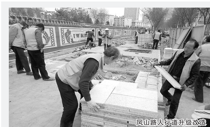
凤山路人行道升级改造