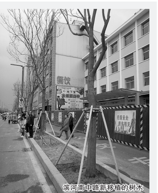
滨河南中路新移植的树木

一年之计在于春,近段时间以来,市区城建部门抢抓当前种植绿化、工程建设宝贵时机,全面加快推进市区街道绿化提升、风貌整治进度,全力实施人行步道、小广场等一批重点工程建设项目,进一步提升城市整体形象,努力让“二青会”胜利召开创造良好环境,打造宜居宜业的美丽中心城区。