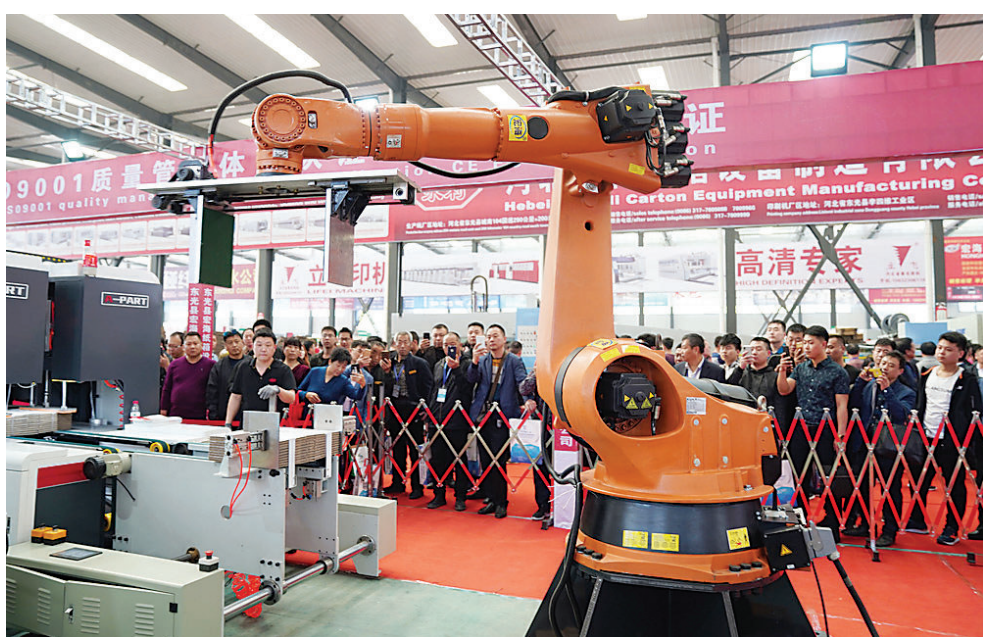
4月17日,参展厂商工作人员为客商演示一款机械臂。

从近期发布的一系列经济数据中可以明显看出经济企稳趋势。采购经理指数(PMI)结束连续三个月低于荣枯线重返扩张空间;固定资产投资稳步提升;消费者信心指数进一步回升;3月新增人民币贷款增幅明显高于历史同期……这些超预期的指标,既释放出稳的信号,也反映了不断改善的市场预期。国际货币基金组织最新一期报告在调低对今年世界经济增长预期的同时,调高了对中国经济前景的展望,说明国际社会看好中国经济。