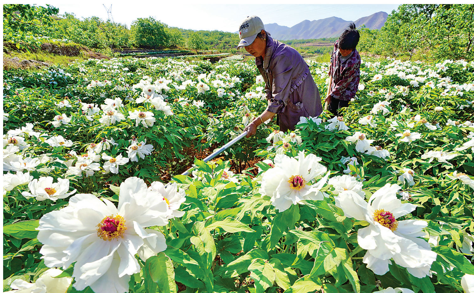
5月17日,迁西县东莲花院乡东莲花院村的农民在油田牡丹种植基地除草。

随着气温升高,美丽的太湖水再次 面临蓝藻水华威胁,今年累计水华面积已接近159平方公里,同比上升44.6%。不只太湖,洱海、抚仙湖等重点湖库保护形势也依然严峻。空气质量还处于“气象影响型”阶段,稍有松懈就有可能出现反复。 全国生态环境保护大会指出,我国生态环境质量持续好转,出现了稳中向好趋势,但成效并不稳固。 生态环境部部长李干杰说,我国生态环境保护形势依然严峻,打好污染防治攻坚战面临多重挑战,环境治理越来越要啃硬骨头。要正视问题和挑战,保持加强生态文明建设的战略定力。 道阻且长,行则将至。 中央生态环境保护督察在近期完成督察“回头看”反馈后,将从今年起启动第二轮督察。 就在前几天,杭州市出台新规定,将国三排放标准柴油货车作为机动车污染防治重点。 针对水质严重恶化的大旱河,辽宁营口市将针对企业废水直排环境问题开展多部门联合排查,严查非法排污行为。 河北省提出到2020年,全省完成营造林1667万亩,森林覆盖率达到36%以上…… 建设一个天蓝、地绿、水净的美好家园,我们一直在努力。久久为功,美丽中国的美好蓝图一定能早日实现! (新华社北京5月17日电)