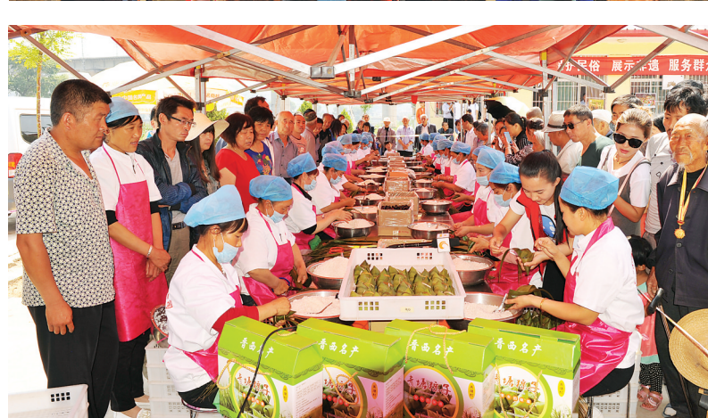
青塘粽子香飘天下