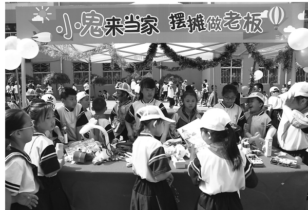
六一儿童节之际,离石龙凤小学组织了一次小小跳蚤市场活动,每个班为一个商家,所有学生参与买卖。

这里有古今罕见的新建大型的湿地公园,命名为“蔚汾公园”。我也多次去过兴县,从来没有见过这野河滩里有过休闲娱乐的公园,这确实是古今奇观。过去到兴县只能见到头上戴着白羊肚毛巾,面朝黄土背朝天的老百姓。现在变了,进入公园,走过小桥,欣赏流水,越过漫道,花前柳下,便是健身广场。春寒料峭已有老少男女,着裙露脐,粉面油头,翩翩起舞。有的跳着交谊舞,有的跳着