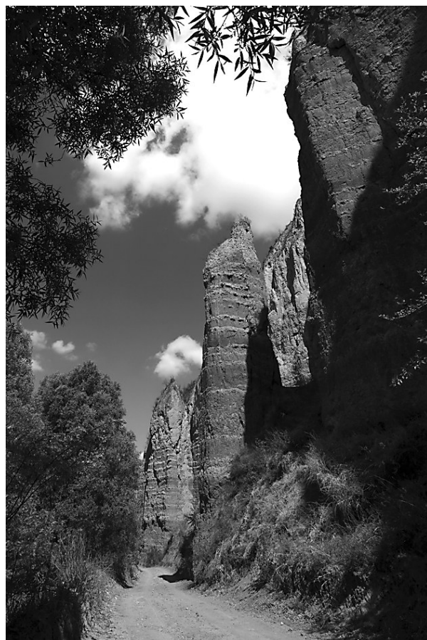
柳林县留誉镇有一个未开发的“红土公园”。该地黄土天然分层,土林奇特,吸引了全国各地的摄影人士采风,具有很大的开发价值。

此次改革,将在继续推进社会代办机动车登记服务的基础上,全面推行汽车4S店代发临时行驶车号牌,群众在4S店可以现场购车、现领牌照,既方便群众购车后上路行驶,又营造良好营商环境。