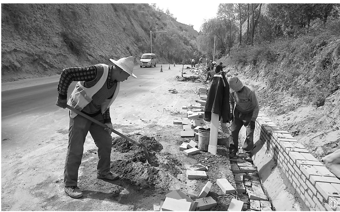
今年以来,我市各地掀起以高速公路、国道、省道和县乡道路沿线为重点,深化以绿化、美化、净化为内容的“三三三”专项整治行动,清脏、治乱、拆违、植绿,多管齐下,全面推进乡村生态环境大改观,农业农村高质量发展,努力实现让农业更强、农村更美、农民更富的美好愿景。