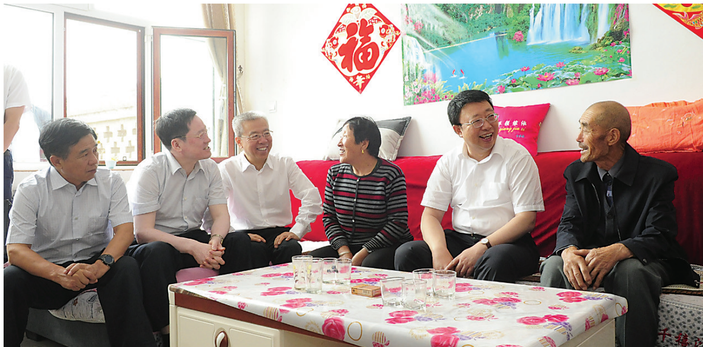
图为省政协主席李佳在省政协副主席、市委书记李正印等领导的陪同下在临县城庄镇五和居新村调研。

本报讯(记者 李雅萍)6月4日至5日,省政协主席李佳深入我市汾阳市、离石区、临县、兴县,就转型发展、脱贫攻坚等进行调研。省政协副主席、市委书记李正印,市委副书记、市长王立伟,市政协主席刘云晨,省政协机关党组书记、副秘书长张岐