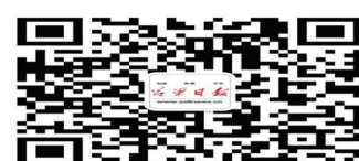
吕梁日报微信公众号

作经验交流会议精神,准确把握地方政协的定位和职责。要明确政协主要工作是协商,明确主要工作方式是“搭台”,明确工作主旨是双向发力。要坚决落实要求,保证协商频次,完善协商机制,丰富协商形式,完善组织保障。要遵循工作规律,坚持求真务实,坚持张弛有度,坚持稳中求进。刘云晨强调,要深化拓展大讨论成果,在强化党的全面领导上下功夫,在强化科学理论武装上下功夫,在“两支队伍”建设上下功夫,在政协系统的联系指导下下功夫,推动政协工作创新发展。