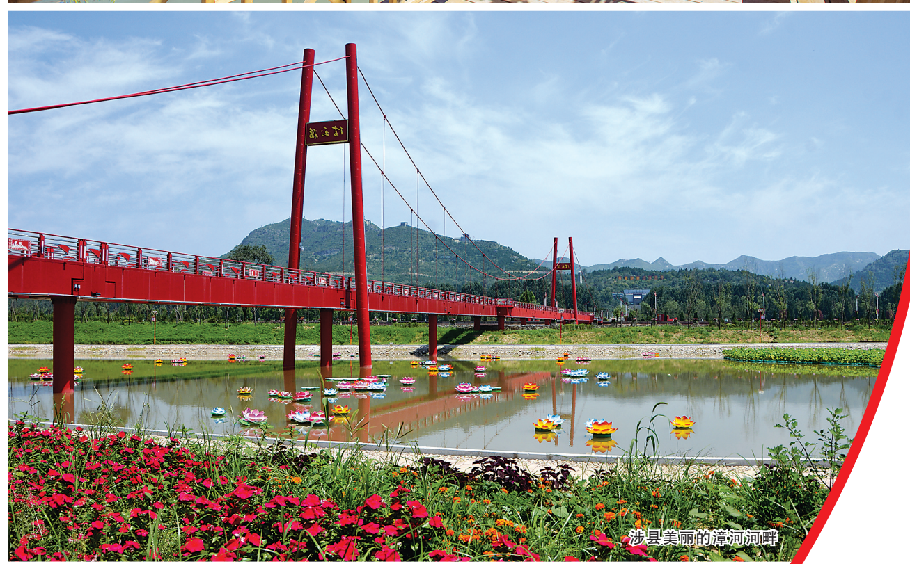
涉县美丽的清河河畔