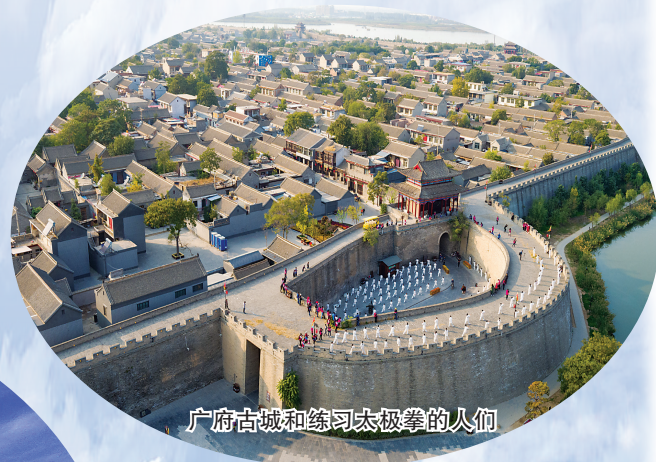
广府古城和练习太极拳的人们