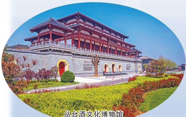
丛台酒文化博物馆