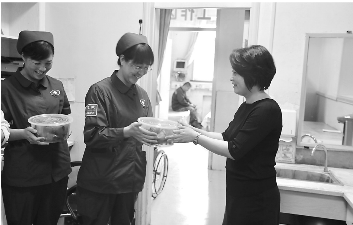
又逢端午节,粽香情更浓。端午佳节前夕,市人民医院工会为奋战在临床一线的工会会员送去了节日的祝福,送上了医院对全院辛勤工作职工的关心与关爱。

“怕事,永远解决不了问题。大胆,总能找到一条出路。”雒保廷总是把这句话挂在嘴上。当问他为何总是这般“敢担当”时,他的回答铿锵有力:“因为我是一名共产党员。”