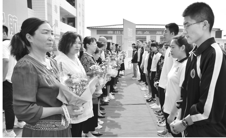
6月4日,文水山西徐特立高级职业中学举行“青春梦想,扬帆起航”2019届高三毕业典礼。该校创新德育方式,通过校长致辞和“同学缘”“父母恩”“师生谊”“母校情”“梦想起航”五个篇章,升华学生情感,鼓励他们带着梦想起航,描绘新的人生轨迹。