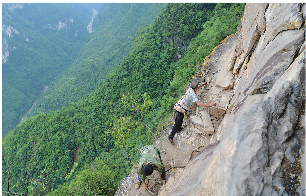
6月10日,陈显兵(下)和村民夏家爱在悬崖上清理石头。地处大山深处的湖北省恩施土家族苗族自治州巴东县大支坪镇尚家村,壁立千仞,风光壮美。为改变贫困落后的面貌,今年51岁的村民陈显兵从2017年开始,在村里的支持下,带领群众开始在“天心眼”绝壁上修路,目前已修出了一条几公里长的简易观光山路。乡亲们希望这里的绝壁美景能够被开发,通过发展旅游,带动村民致富。

王继华说,薛剑强用不怕牺牲的精神诠释了“英雄”二字。“和平年代同样需要英雄情怀。英雄是民族的火炬,精神的坐标,要让烈士的家国情怀成为当代青年的追求,汇聚昂扬向上的精神力量,自觉践行社会主义核心价值观。”