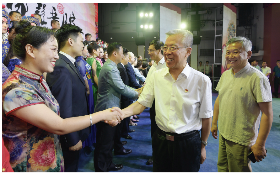
图为演出结束后,省政协副主席、市委书记李正印,市委副书记、市长王立伟,国家京剧院党委书记、院长宋晨等领导接见演职人员。

本报讯(记者 李雅萍) 赏国粹雅韵,品梆声晋腔。为进一步弘扬优秀传统文化,促进京剧艺术发展,7月5日晚,在我市采风的国家京剧院与市直院团吕梁市晋剧院、吕梁市青年晋剧院在吕梁影剧院举行结对共建专场演出。省政协副主席、市委书记李正印,市委副书记、市长王立伟,国家京剧院党委书记、院长宋晨等领导观看演出。