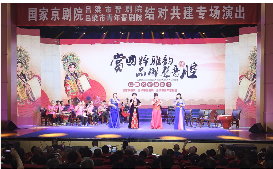
图为国家京剧院与吕梁市晋剧院、吕梁市青年晋剧院结对共建专场演出。

本报讯(记者 李雅萍) 赏国粹雅韵,品梆声晋腔。为进一步弘扬优秀传统文化,促进京剧艺术发展,7月5日晚,在我市采风的国家京剧院与市直院团吕梁市晋剧院、吕梁市青年晋剧院在吕梁影剧院举行结对共建专场演出。省政协副主席、市委书记李正印,市委副书记、市长王立伟,国家京剧院党委书记、院长宋晨等领导观看演出。