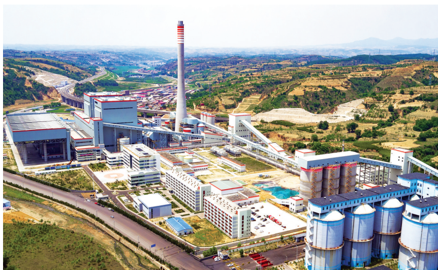
山西京能吕梁发电有限公司位于临县城庄镇,项目总投资为6.2亿元,目前正处于系统调试阶段,投产后年可发电35亿千瓦时,产值约3.5亿元,可提供就业岗位300余个。