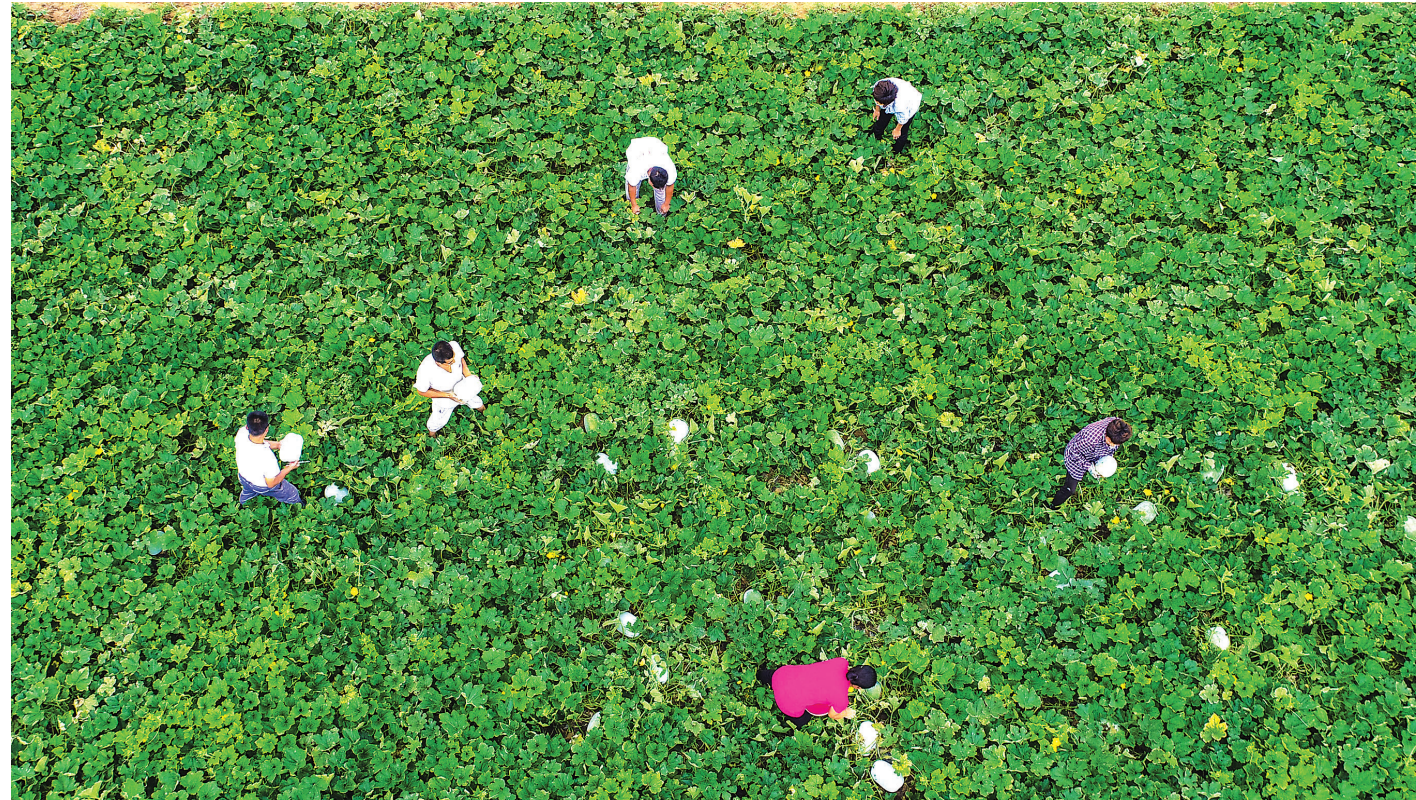
7月7日,在河北省故城县建国镇姜圈村蔬菜基地,种植户在采摘冬瓜(无人机拍摄)。

这时,广大指战员也纷纷质疑博古、李德执行的错误路线。“从老山界开始的争论,持续到湖南通道境内。”《红军长征史》写道。陈兴华说,这为红军实事求是制定正确战略方针打下了基础,促成了中国革命的伟大转折。