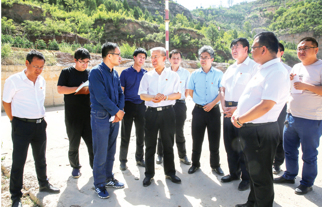
图为省政协副主席、市委书记李正印在石楼县裴沟村调研屈产河裴沟断面治污情况。