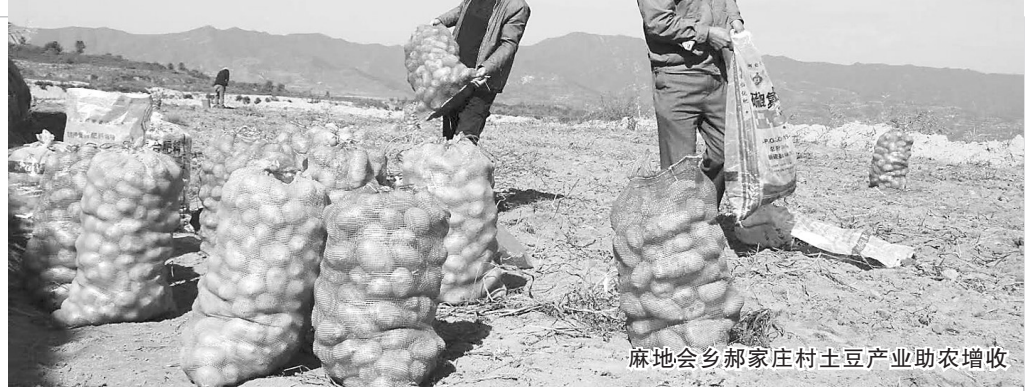
麻地会乡郝庄村土豆产业助农增收

麻地会乡党委以“5+N”主题党日“常态化”制度化为载体,以《党支部工作纪实手册》为抓手,推进全乡各级党组织党内组织生活规范化。积