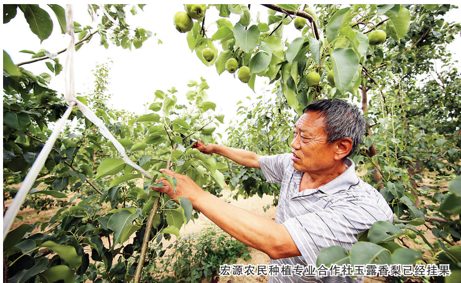
宏源农民种植专业合作社玉露香梨已经挂果

把传统的种地变成高端产品，让老百姓通过合作社经营的方式，把土地的价值最大化。下栅乡首届樱桃节的举办，成为孝义市加快农业农村现代化的鲜明注脚。合作社现有的260亩土地都是从下栅、坛果两村村民手中流转过来的，而承包土地的村民大部分成为了合作社社员，目前社员可得到每亩每年400元的土地流转金。据专业技术人员测算，进入盛果期后每亩的收益可能达到1万元左右。合作社现有社员100名，其中一半是建档立卡贫困户，随着合作社的不断发展，社员的收入会越来越多，脱贫致富不再遥远。