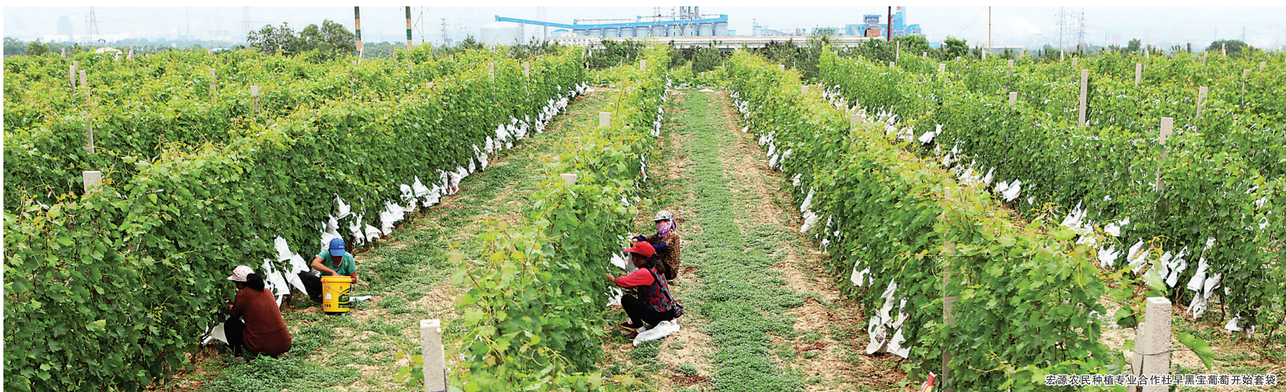
宏源农民种植专业合作社早黑宝葡萄开始套袋

孝义的城市和乡村，大大小小的粮油店有几百家，走进任何一家店，你都会听到这样的声音，“来一袋下栅面！”下栅面已成为孝义及周边县市百姓一日三餐不可或缺的食粮。