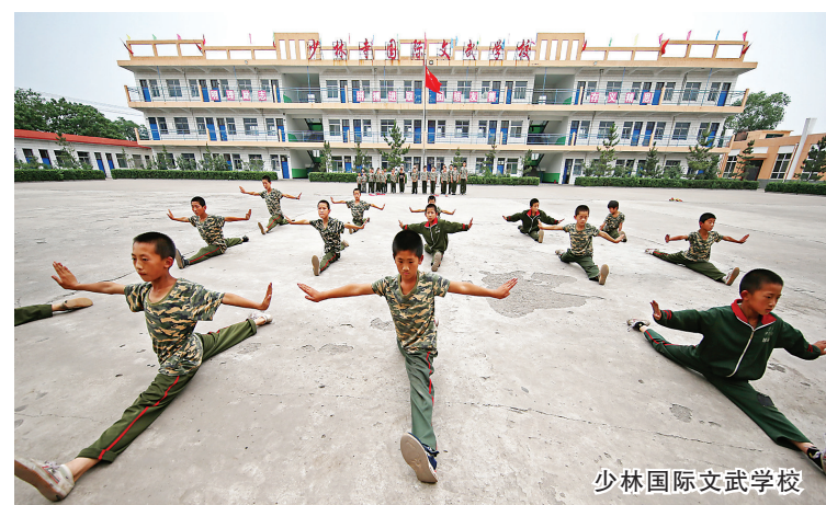
少林国际文武学校