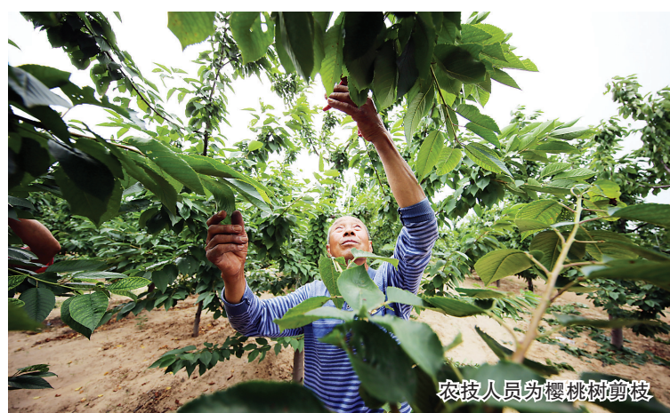
农技人员为樱桃树剪枝