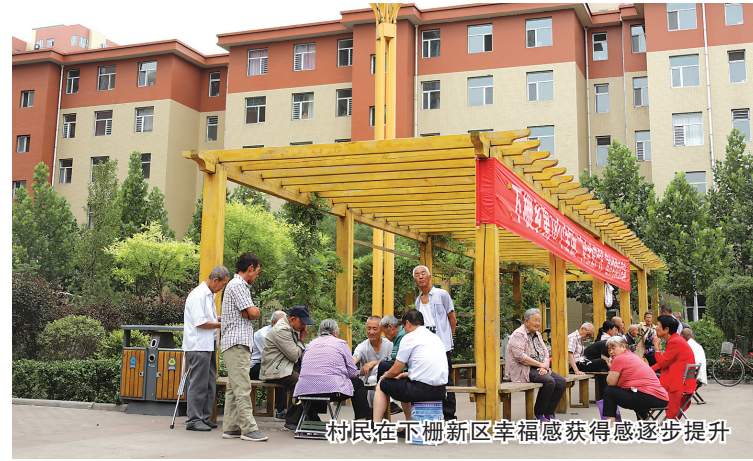
村民在下栅新区幸福感获得感逐步提升