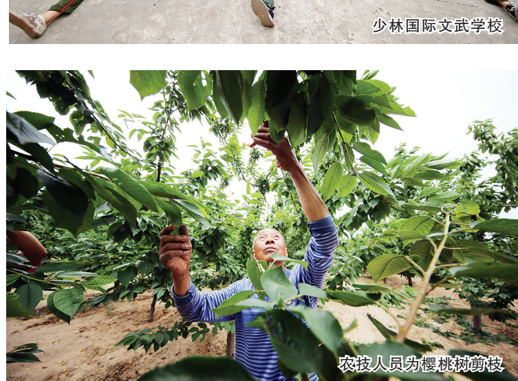
农技人员为樱桃树剪枝