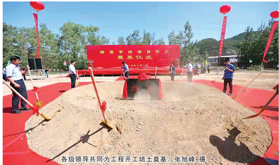
各级领导共同为工程开工培土奠基。