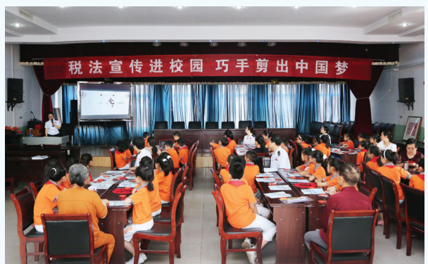
税法宣传进校园 巧手剪出中国梦