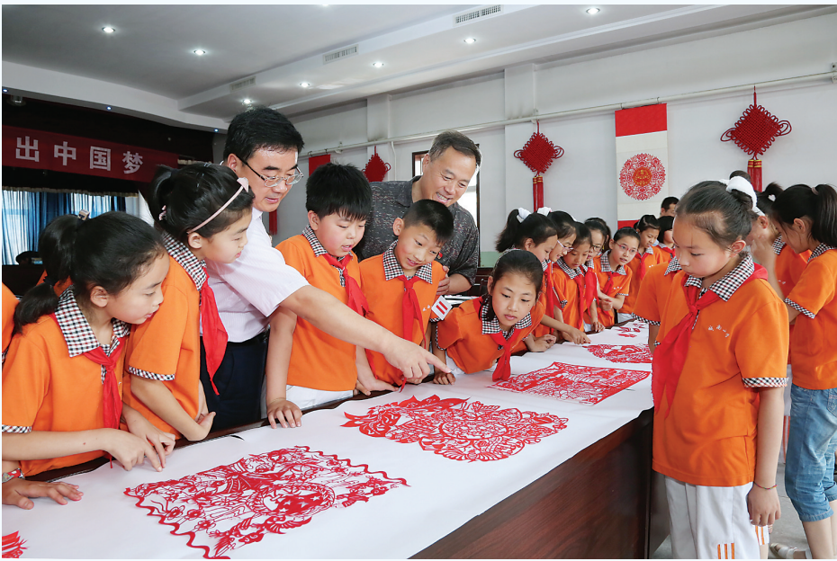
近日,中阳县税务局携手中阳县剪纸协会走进城南小学,把税法宣传与国家级非物质文化遗产——中阳剪纸巧妙结合,为小朋友们送上一堂妙趣横生的税收知识课。活动通过剪纸艺人手把手指导创作以税收为主题的作品、幻灯片讲解、发放税收宣传资料等形式,让同学们对税收的本质、来源及作用都有了感性的认识,在他们心中种下纳税意识,增强了“教育一个孩子,影响一个家庭,带动整个社会”的辐射效应。