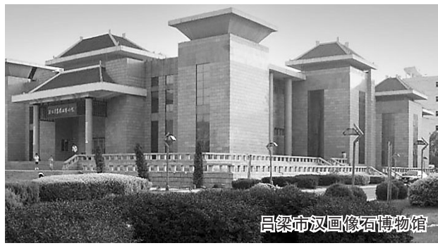
吕梁市汉画像石博物馆

孝河湿地是山西省2014年转型综改重大项目之一,也是山西省转型综改的标杆工程。规划总面积5.47平方公里,其中水域面积约3.28平方公里。孝河湿地属黄土高原典型的次生湿地,是国内少有的集区域水利、城市湿地、生态文化、民俗景点于一体的主题湿地公园。