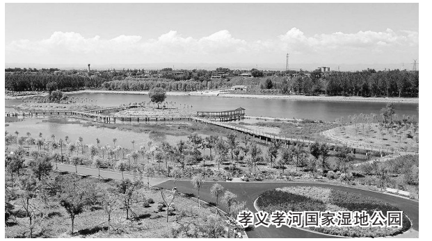
孝义孝河国家湿地公园

仪式音乐流传。由于祈雨仪式在当地民众生产、生活中的独特地位,“钹子”音乐一方面随着祈雨文化代代传承,并被当地百姓作为祭祀音乐,而保持其作为仪式音乐的庄严性;另一方面逐渐与民众的生活习俗结合,成为迎神赛社和日常迎宾的仪仗音乐。