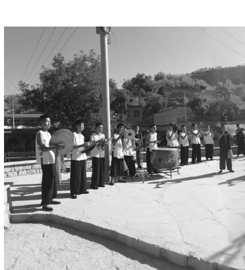
图为临县大喇叭展演现场。演员们精湛的演奏,原汁原味的地方曲调,展现着临县大喇叭的粗犷、豪放、激昂的音色,表现晋川小喇叭清亮、明快、委婉细腻的特征,让观众看得如痴如醉、掌声雷动。临县大喇叭是该县传统的民间艺术之一。近年来,该县大力实施文化兴县战略,积极弘扬优秀传统文化,深入挖掘民间艺术、传统手工艺文化内涵,着力培育新兴产业,取得了丰硕成果。