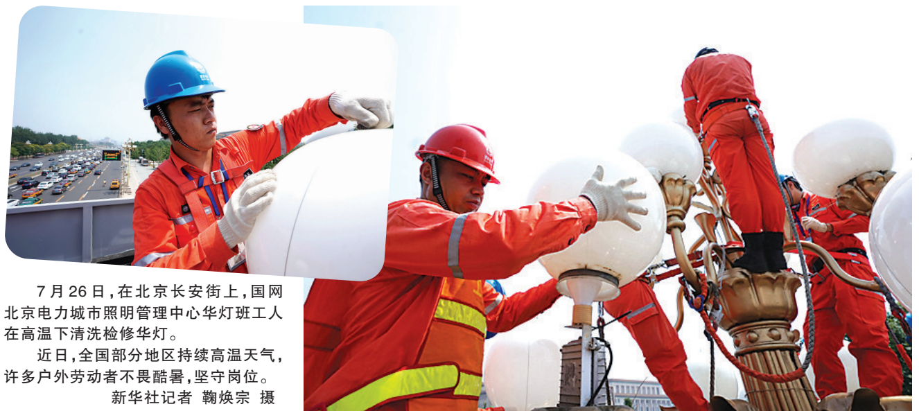
7月26日,在北京长安街上,国网北京电力城市照明管理中心华灯班工人在高温下清洗检修华灯。近日,全国部分地区持续高温天气,许多户外劳动者不畏酷暑,坚守岗位。

率超过90%的世界最大社会保障安全网;推动发展方式、生活方式“绿色变革”,美丽中国建设迈出决定性步伐……“以利民之事,丝发必兴”的为民情怀,补短板、强弱项,把百姓的烦心事操心事当作头等大事来办,带给群众更多获得感、幸福感、安全感。民生无小事,枝叶总关情。始终把人置于最高位置,与人民同呼吸、共命运、心连心,我们党就能永远保持与人民群众的血肉联系,永远做中国人民和中华民族的主心骨。中国共产党最大的政治优势是密切联系群众,党执政后最大的危险是脱离群众。正在深入开展的“不忘初心、牢记使命”主题教育,再一次宣示和砥砺中国共产党人“为人民谋幸福,为中华民族谋复兴”的初心与使命。与人民想在一起、干在一起,“为人民服务,担当起该担当的责任”,我们党团结带领近14亿人民同心筑梦、实干兴邦,必将创造令世界刮目相看的新奇迹。新华社北京7月30日电