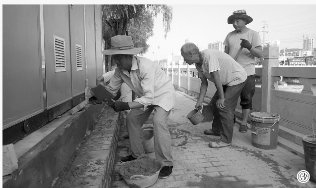
高石东川河道蓄水及音乐梦幻喷泉景观工程,是今年市区铺开的重点工程之一,在有关部门的大力支持与配合下,项目施工单位抽调精兵强将,冒酷暑,战高温,精心组织,科学施工,千方百计保质量,攻坚克难抓进度,目前工程已进入竣工验收调试运行阶段。该水景公园的建成将为吕梁市区的山水园林城市的美景增添更加亮丽的风景,为市区群众增添一份惬意。 图①东川河道景观工程开始蓄水试运行。 图②工人们安装完善喷泉线路。 图③景观工程变压台站施工冲刺。 图④市民从安装好的喷泉设施边经过。