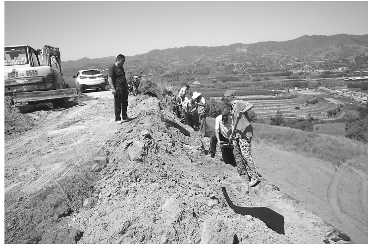
图为方山县麻地会乡水沟湾的村民们正在抢修上山路。近日的强降雨使水沟湾的上山路严重受损,为不影响村民们上山劳作,该村及时组织劳力对受损的路进行修复。

离石区人社局及时完善了申领流程,指定专人负责审批。领取待遇人员在2019年1月1日之后死亡的,其指定受益人、继承人填写《离石区城乡居民养老保险丧葬补助金申请表》,由村(居)主任或支书签字、乡镇(街道)主要领导签字盖章后,携带继承人证明、死亡注销证明、受益人身份证(包括户口本)、社保卡复印件一并报区农保中心,农保中心审核后,按月向区财政申请资金,并拨付到受益人的社会保障卡里。(王宏伟)