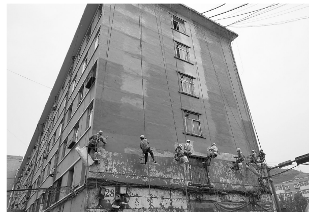
连日来,在孝义市水峪工矿区各个老旧小区,工人们顶着炎炎烈日“飞檐走壁”,为6层高的楼房粉刷外墙,使昔日楼房外墙和楼道内墙成了“大花脸”的老旧小区面貌焕然一新。

相应注销流程,强化内部流转,清理多余环节,有效降低了注销难度,提升了注销效率。二是简化注销材料。严格按照“放管服”改革要求简化纳税人涉税注销材料,纳税人需要准备的注销材料减少了50%以上。三是明确注销清单。为帮助纳税人更好地了解注销流程,推出注销指南对注销流程进行详尽介绍,办理注销业务的纳税人只要按照注销指南很快就可以完成税务注销。 (张耀达)