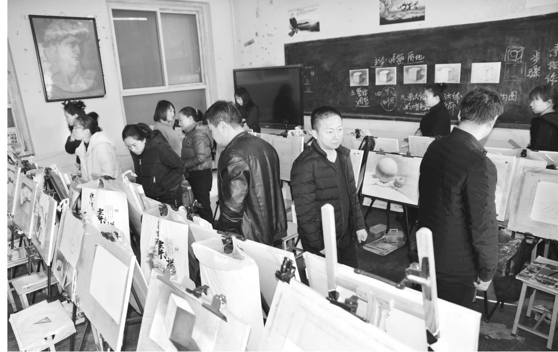
11月23日,文水山西徐特立高级职业中学开展了丰富多彩的家长开放日活动。学校领导与家长们就学校的内涵管理、中高职衔接、对口升学、直接就业、国际化多元化办学模式等工作进行了沟通交流。该校通过开展家长开放日活动,旨在进一步加快推进学校、家庭、社会“三位一体”德育教育模式,全面提高职业教育人才培养质量,营造良好的育人环境。

爱路护路宣传活动,还以展出护路宣传展板,悬挂宣传挂图等方式进行,活动中,共宣传教育师生500余人,发放宣传册100本,笔记本50本,书包30个,笔袋50个,旨在通过一个孩子影响一个家庭,一个家庭带动一片居民区,从而达到全社会知路、爱路、护路,共筑安全铁路的目的,取得了良好的宣传教育效果。