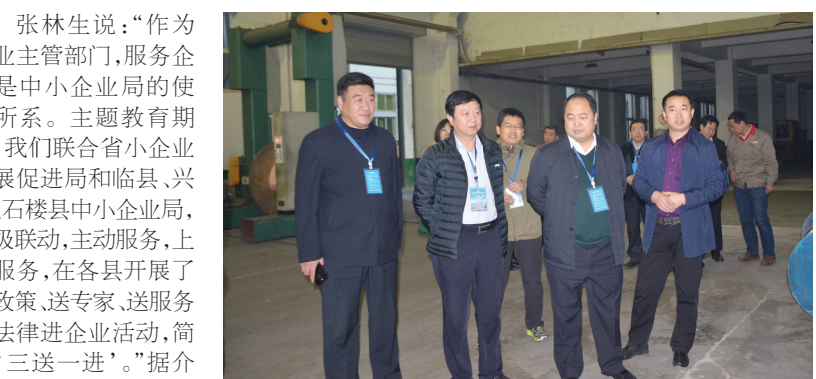
图为张林生在企业调研。

“‘不忘初心、牢记使命’主题教育开展以来,市中小企业局紧扣习近平新时代中国特色社会主义思想主线,坚持‘守初心、担使命,找差距、抓落实’的总体要求,激发和凝聚全局上下干事创业、为民服务的热情和力量,全力服务企业、服务群众、服务基层,真正实现让企业真受益、让群众得实惠。”近日,市中小企业局党组书记、局长张林生在接受采访时表示。