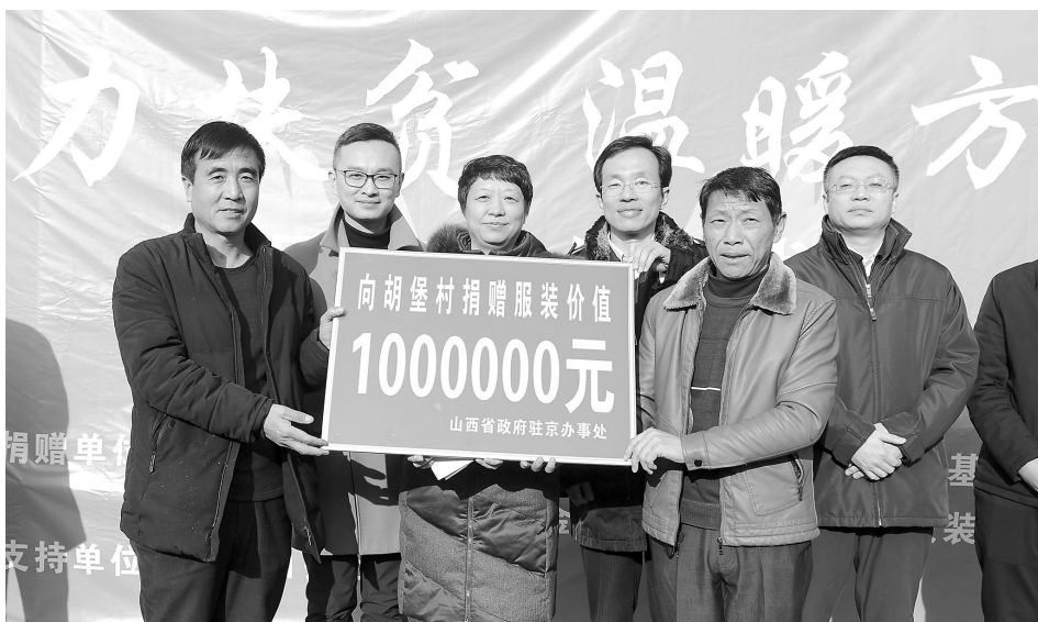
图为省政府驻京办为胡堡村捐赠服装仪式。