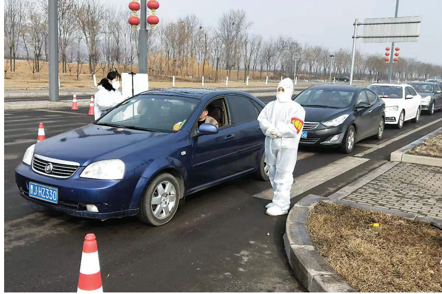
离石区中医院工作人员正在疫情防控检查站工作。

2月1日17时至2日17时,吕梁大道1987辆车,5487人。为过往的每一个人测体温、登记,一个班下来,一次性防护服开裂是常有的事。“就这破了防护服我们也不舍得扔。按规定,口罩4