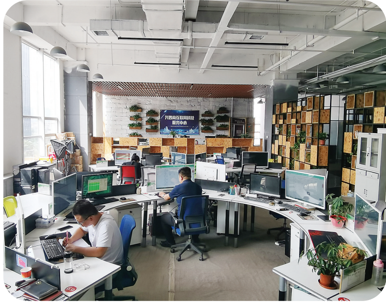
土特产交易工作间