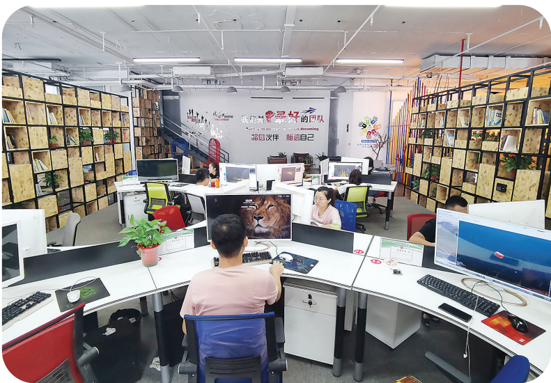
基地亚马逊、淘宝、拼多多、168多功能工作间