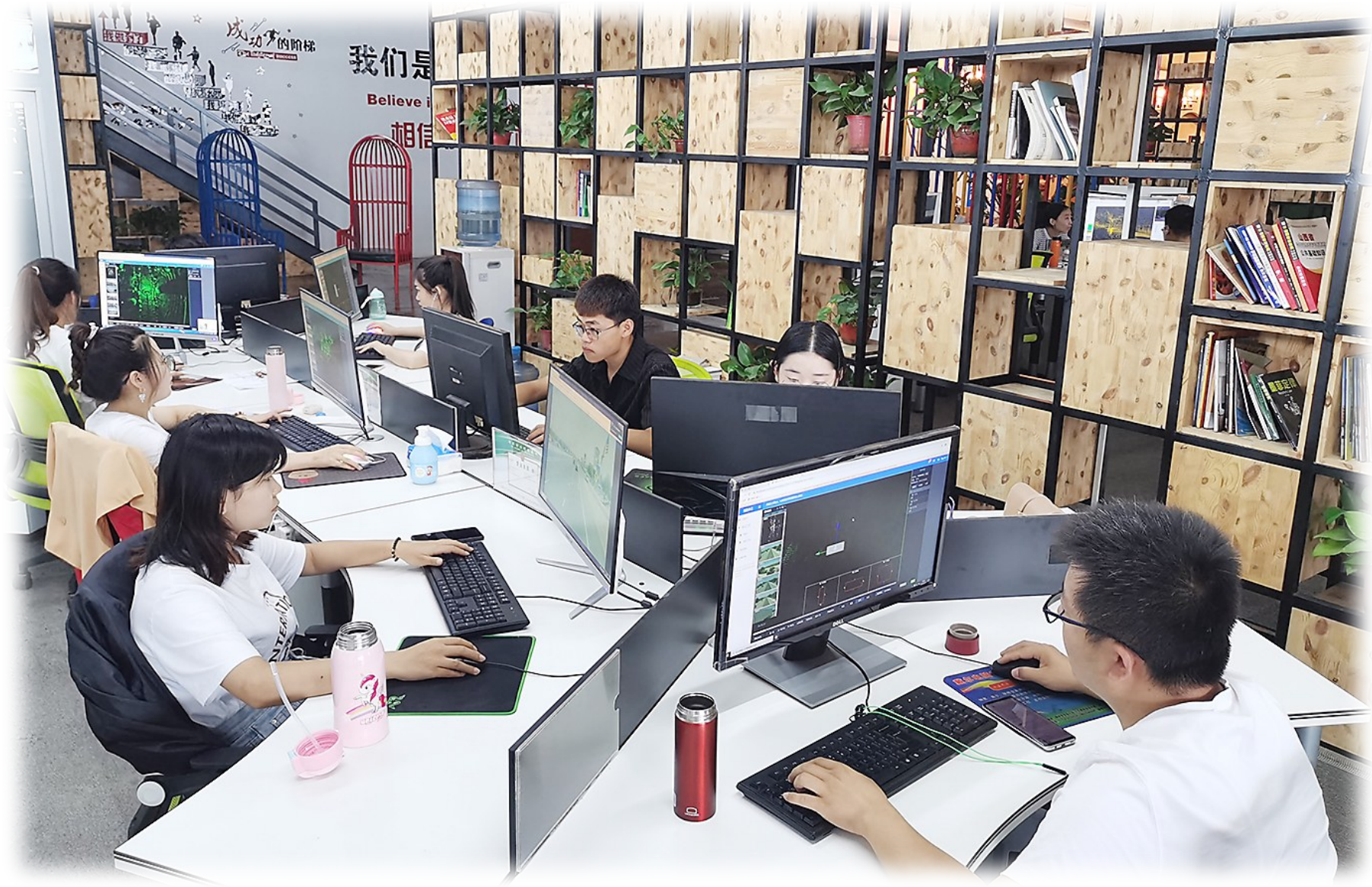
基地大数据工作间