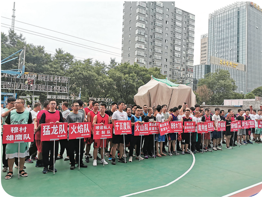
星火项目比赛暨青年创业篮球赛