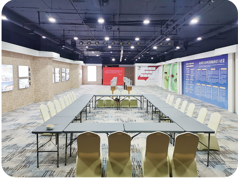
多功能展厅、直播间

去年以来,通过互联网销售,共销售柳林红枣60000斤、核桃30000斤、西瓜40000斤、食用菌各类产品8000多斤,帮助农民节约采购成本22000元,销售各类农产品410000余元,实现增收72000余元,极大的解决了贫困村农产品积压和直销难题,增加了农民的收入。 (张倩)