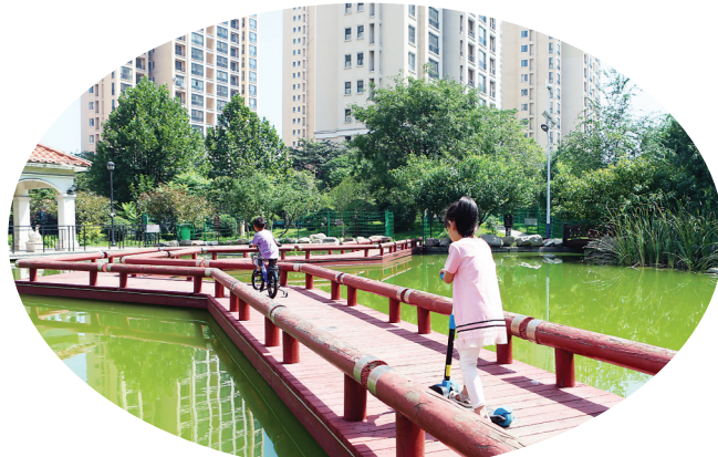
城乡居民环境换新颜