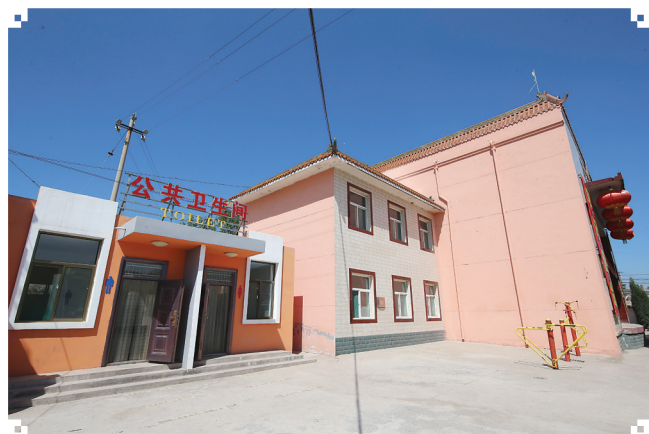
位于下堡镇西程庄村公厕改造已基本完成