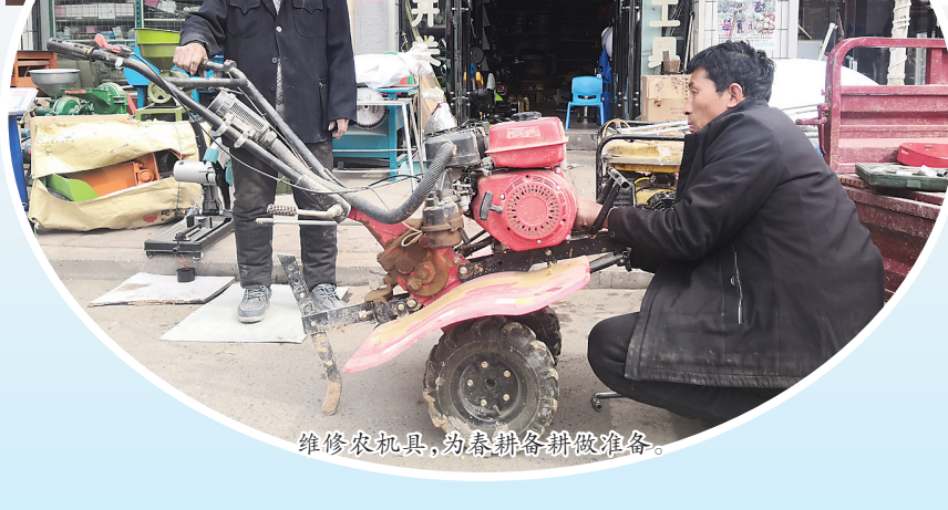
维修农机具，为春耕做准备。

眼下正值春耕备耕关键时期，各地农机销售逐渐火热起来。3月8日，记者在柳林县三交镇一家农机销售点看到，小型旋耕机、各类播种机、小型拖拉机等各类农业机械应有尽有，前来咨询选购的农民络绎不绝。