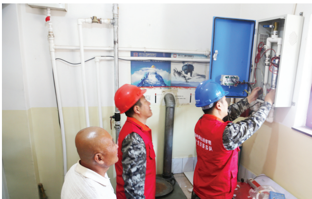
近日，国网孝义市供电公司黎明党员服务队队员在兑镇梁家原村为用户检查漏电保护器和低压线路。

随着活动的持续，该公司30余名黎明党员服务队队员将继续挺进偏远山区、村落，宣传安全用电知识和科学用电方法，帮助用户排查处理电力安全隐患，为村民在迎峰度冬和新春佳节来临之际用上“放心电、安心电”保驾护航，助力乡村更美丽、村民生活更美好。