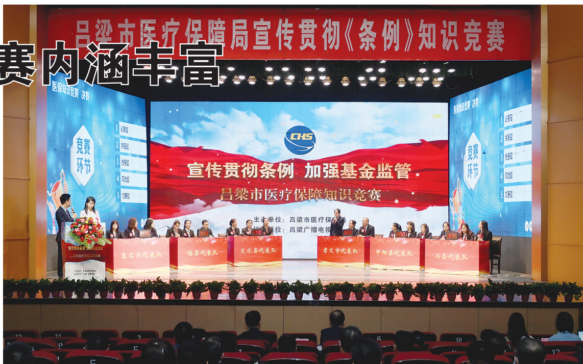
吕梁市医疗保障局宣传贯彻《条例》知识竞赛现场。

据介绍,5月1日起,《医疗保障基金使用监督管理条例》将正式实施,为更好学习宣传贯彻《条例》,市医保局将2021年确定为“条例宣传年”,特别是在当前集中宣传月活动中,全市医保系统以党史学习教育“我为群众办实事”主题实践活动、党员干部进社区报到志愿服务为契机,采取全方位、多渠道、多角度、广覆盖等方式,开展医保政策法规“七进”活动,截至目前,市共印发宣传资料36万余册,在电视、报纸、电台、微信公众平台、抖音等媒体进行了广泛宣传,市区公交车、电子屏等滚动播放条例及打击欺诈骗保标语、宣传片。市医保局通过系列宣传活动,不断将《条例》宣传贯彻引向深入,将经办机构、参保人员、两定机构禁止性行为及相