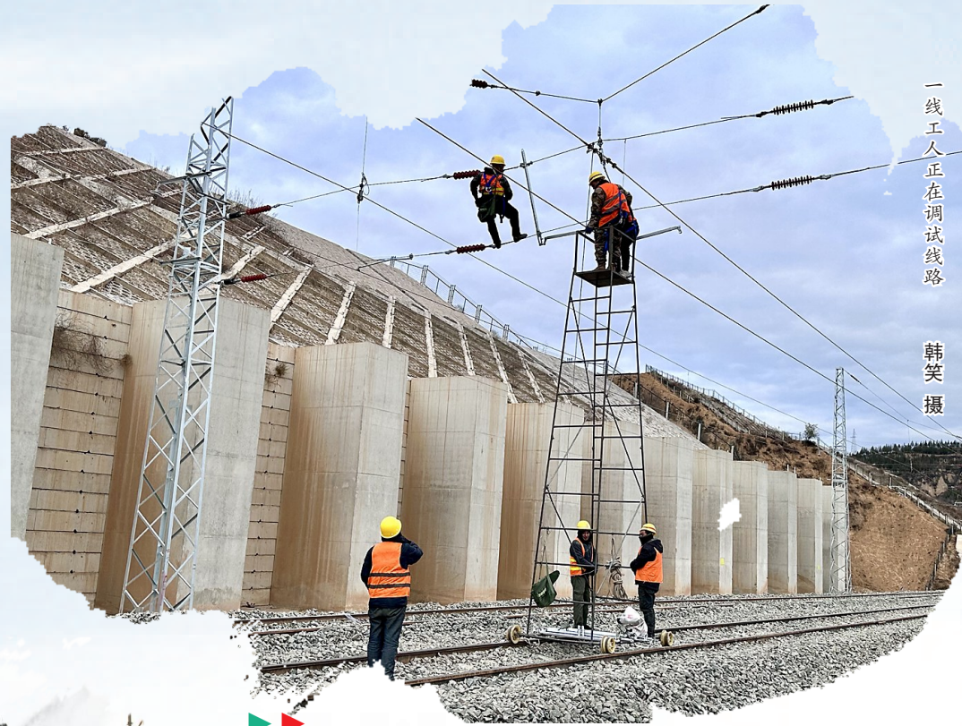
一线工人正在调试线路

实开展到安全文化的深入人心,一系列扎实举措推动安全生产从被动防御向主动防控转变。为强化安全基础工作,推动安全发展,让我们共同凝聚安全共识,提升安全意识,遵守安全规程,将安全理念深植于心、践之于行,携手织密安全生产防护网,为吕梁高质量发展保驾护航。