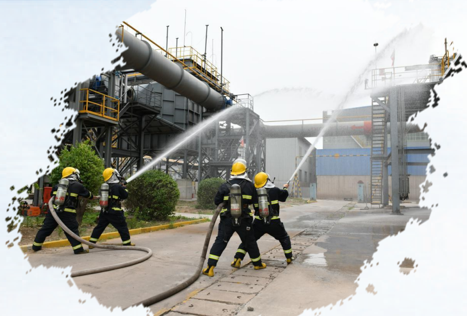
常态化开展消防演练

无论是从消防安全专题培训到应急演练,还是应急技能大比武,该厂将安全训练融入日常,而这些常态化培训的内容设计与组织实施,也正是“123540横到边”部门协同的成果,今年已联合消防、应急等部门开展各类实操培训10余场。“厂长办公室大门永远向大家敞开!”宣讲尾声,姚永强的承诺让员工倍感温暖。他明确表示,安全责任无小事,厂里会始终倾听员工们的声音,广泛征求生产中的意见与建议。这种双向沟通机制,让一线智慧成为安全管理的“活字典”,不少隐患在萌芽状态就被及时消除。安全生产从不是“一阵风”式的运动,而是融入每班每岗的日常坚守。吕梁建龙炼钢厂把月度宣讲、每周夜查、常态化实训这些事抓在经常、做在日常,慢慢让“上班先查安全、操作必守规范”成了全员的行动自觉。“咱们守好安全,既护着自己的小家,也托着厂里的大家。”姚永强的话道出了全员共识,“安全没有终点,只有连续不断的新起点。”这份扎根一线的坚守,既守住了全员平安,也为企业稳扎稳打迈向高质量发展筑牢了根基。