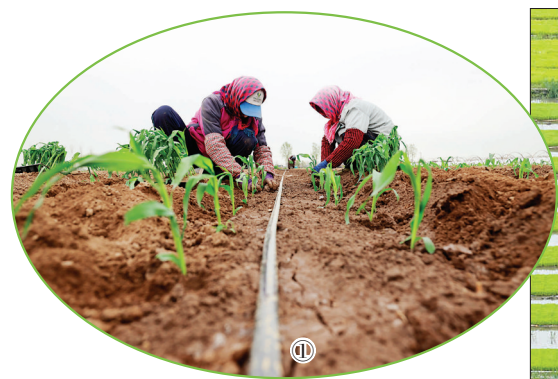
随着气温回升,各地抓紧播种作业,田间地头一派繁忙景象。