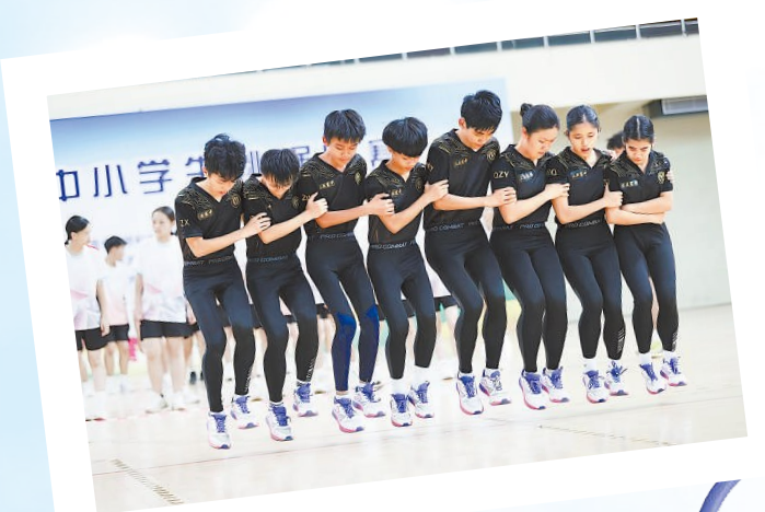
上图为冠军队伍在2026年海南省中小学生跳绳比赛中。