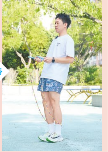
身体后仰,重心不稳