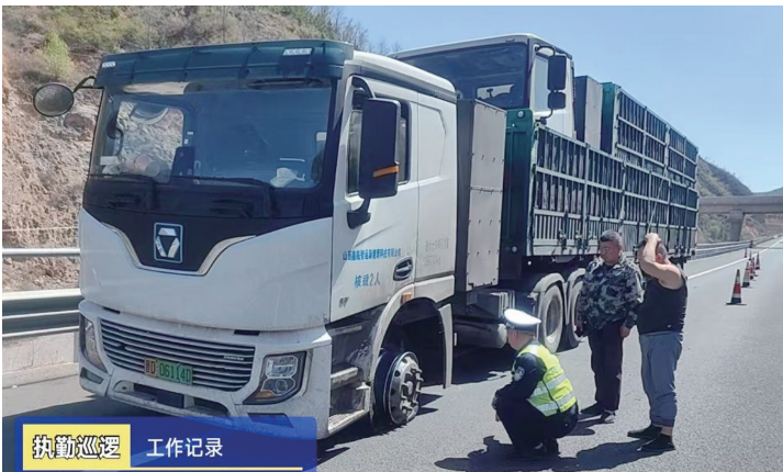
执勤巡逻 工作记录

危急时刻,细节最见真情。一次规范的警示摆放,一句耐心的安全提醒,一份及时的热饭,勾勒出新时代交警队伍“刚柔并济”的履职画卷——他们不仅是交通安全的守护者,更是群众困境中的暖心人。这样的担当,正是平安吕梁最坚实的底色。