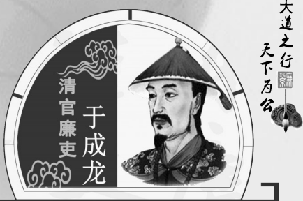
大道之行 天下为公

他捕盗如神,断案如神,微服私访,神出鬼没,忽而严厉,忽而宽容。黄州毕竟是个比较繁华的地方,有舞台也有观众,还有评论员,于成龙的故事也就慢慢传到全国各地。于成龙晚年任两江总督时,基本上不再微服私访了,但广大百姓还是会把所有“白须伟貌”的陌生人当成是微服私访的