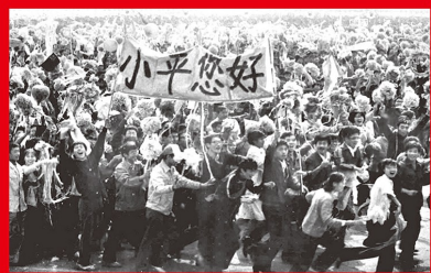
1984年10月1日，首都举行庆祝建国35周年的阅兵仪式和群众游行。邓小平同志检阅阅兵部队。图为参加1984年国庆游行的大学生队伍通过天安门时，打出“小平您好”的横幅。