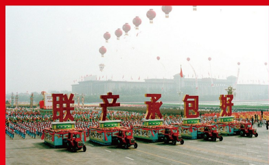
党的十一届三中全会前后，面对严重的农村经济形势，全国一些地方实行“放宽政策”“休养生息”的方针，率先进行改革试验。1980年5月，邓小平指出：农村政策放宽以后，一些适宜搞包产到户的地方搞了包产到户，效果很好，变化很快。图为1984年国庆35周年群众游行队伍中的“联产承包好”彩车。

党的十一届三中全会以来，以邓小平同志为核心的党的第二代中央领导集体，顺应时代潮流和人民意愿，带领全党全国各族人民，深刻总结我国社会主义建设正反两方面经验，借鉴世界社会主义历史经验，彻底扭转十年内乱造成的严重局面，重新确立解放思想、实事求是的思想路线，作出把党和国家工作中心转移到经济建设上来、实行改革开放的历史性决策，深刻揭示社会主义本质，确立社会主义初级阶段基本路线，明确提出走自己的路、建设中国特色社会主义，创立了邓小平理论，成功开创了中国特色社会主义。