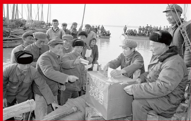
选举人大代表是人民当家作主的重要体现，也是人民代表大会制度的基础。1979年，将直接选举人大代表的范围扩大到县级，实现普遍的差额选举；2010年，明确城乡按相同比例选举人大代表。中国选举制度不断发展完善。图为1981年安徽省嘉山县女山湖渔业公社（现明光市女山湖镇）的渔民投票选举人大代表。