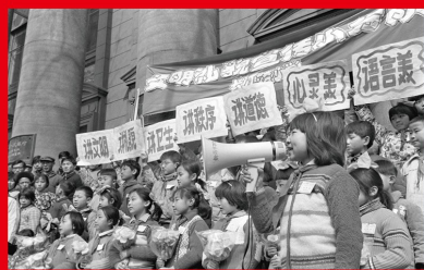
1982年，中共中央办公厅转发了中宣部《关于深入开展“五讲四美”活动的报告》，“五讲四美”活动和“三热爱”活动相结合，形成了上世纪80年代社会主义精神文明建设的经典口号。图为1982年3月，江苏省南京市长江路小学的少先队员们进行“五讲四美”宣传活动。