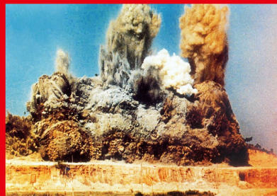
1980年8月，全国人大常委会颁布《广东省经济特区条例》，深圳经济特区成立。在这之前，第一个出口加工工业区于1979年7月在深圳蛇口破土开建，打响中国改革开放的“第一炮”。