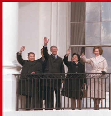
1979年1月29日，卡特总统在华盛顿白宫为邓小平副总理举行正式欢迎仪式。欢迎仪式后，卡特总统和夫人罗莎琳·卡特、邓副总理和夫人卓琳登上白宫接待厅前的阳台，向草坪上的群众挥手致意。

不坚持社会主义，不改革开放，不发展经济，不改善人民生活，只能是死路一条。基本路线要管一百年，动摇不得。