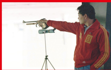
1984年洛杉矶奥运会，许海峰获男子手枪60发慢射冠军，实现了中国奥运会历史上金牌“零”的突破。截至2017年，中国运动员共获得奥运冠军240个，世界冠军3340个，创造世界纪录1300次，涌现了一大批全国人民耳熟能详的优秀运动员和英雄集体。图为许海峰在洛杉矶奥运会男子自选手枪射击比赛中。