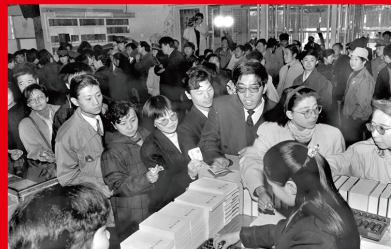
1997年9月，党的十五大阐述了邓小平理论的历史地位和指导意义，把邓小平理论确立为党的指导思想。图为1993年群众在新华书店争相购买《邓小平文选》第三卷。