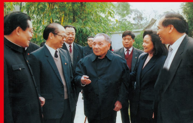
1992年1月18日至2月21日，邓小平同志视察武昌、深圳、珠海、上海等地并发表重要讲话，科学总结党的十一届三中全会以来实行改革开放的基本实践和基本经验，从理论上深刻回答了长期困扰和束缚人们思想的许多重大问题。图为邓小平同志在广东省视察。