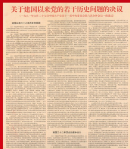
1981年6月，党的十一届六中全会通过《关于建国以来党的若干历史问题的决议》，对新中国成立32年来的历史作了科学总结，彻底否定“文化大革命”，实事求是地评价毛泽东同志的历史地位，标志着党在指导思想上的拨乱反正胜利完成。全会选举邓小平为中央军委主席。