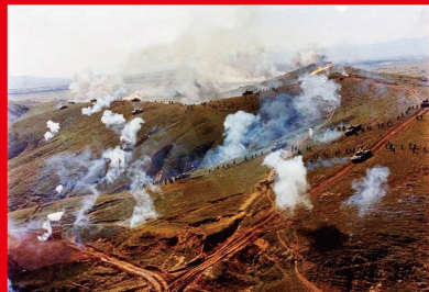
1985年5月23日至6月6日，中央军委召开扩大会议，作出军队和国防建设指导思想实行战略性转变的重大决策，即从准备“早打、大打、打核战争”的临战状态，真正转到和平时期的建设轨道上来，并作出减少军队员额100万的决策。图为华北军事演习现场。