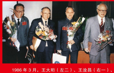
1986年3月，王大珩（左二）、王淦昌（右一）、杨嘉墀（右二）和陈芳允（左一）四位科学家向中共中央提出《关于跟踪研究外国战略性高技术发展的建议》。中共中央、国务院在此基础上批准实施了《高技术产业发展计划纲要》（“863”计划）。