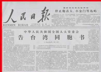
1979年1月1日，全国人大常委会发表《告台湾同胞书》，郑重宣示了争取祖国和平统一的大政方针。