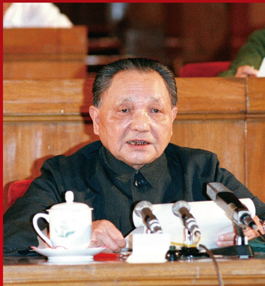
1982年9月1日至11日，中国共产党第十二次全国代表大会在北京举行。邓小平在开幕词中强调指出：“把马克思主义的普遍真理同我国的具体实际结合起来，走自己的道路，建设有中国特色社会主义，这就是我们总结长期历史经验得出的基本结论。”大会提出了全面开创社会主义现代化建设新局面的宏伟纲领。

不坚持社会主义，不改革开放，不发展经济，不改善人民生活，只能是死路一条。基本路线要管一百年，动摇不得。