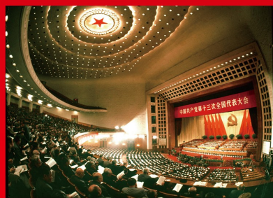
1987年10月25日至11月1日，中国共产党第十三次全国代表大会在北京举行。大会对社会主义初级阶段的科学内涵作了系统阐述，明确概括了党在社会主义初级阶段的基本路线，对加快和深化改革作出全面部署。