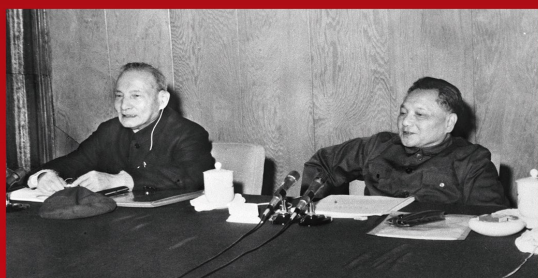
1978年12月18日至22日，党的十一届三中全会在北京召开。全会作出把工作重点转移到社会主义现代化建设上来和实行改革开放的决策，实现了新中国成立以来党的历史上具有深远意义的伟大转折，开启了改革开放和社会主义现代化建设新时期。图为邓小平同志和陈云同志在十一届三中全会上。