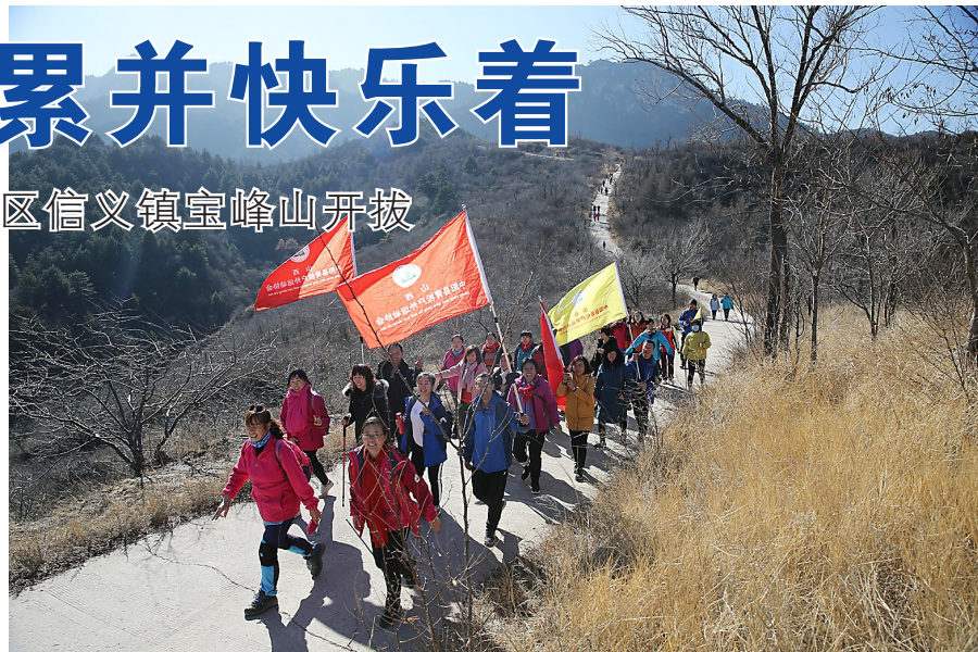
参加活动的户外运动爱好者挥舞旗帜,享受着登山的快乐。

本报讯(记者 曹永亮 通讯员 温保翠)1月13日,农历12月初8,是我国的传统节日“腊八节”,当天,2019年首届趣味登山活动在离石区信义镇宝峰山开拔。本次活动由吕梁市户外运动协会主办,吕梁各户外俱乐部协办。