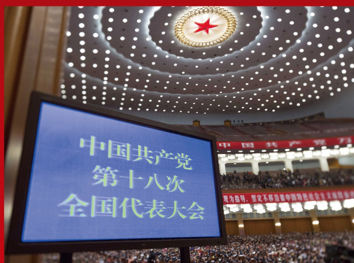
党的十八大根据我国经济社会发展实际，提出要在十六大、十七大确立的全面建设小康社会目标的基础上，到 2020 年实现全面建成小康社会的宏伟目标。