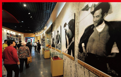
2013 年 6 月至 2014 年 10 月，自上而下分两批在全党深入开展以为民务实清廉为主要内容的党的群众路线教育实践活动。图为党员干部群众参观焦裕禄同志纪念馆。