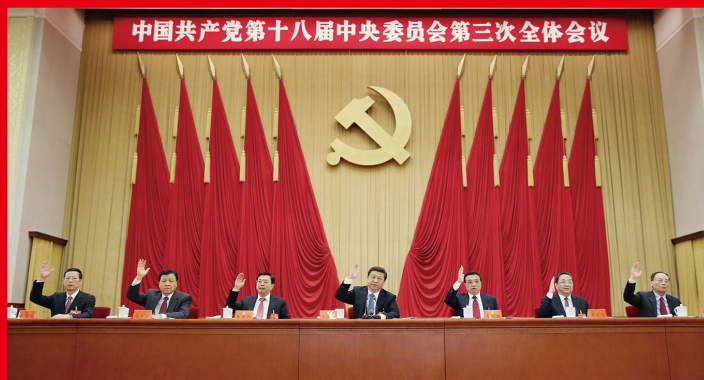
2013 年 11 月 9 日至 12 日，党的十八届三中全会在北京举行。全会通过《中共中央关于全面深化改革若干重大问题的决定》，指出全面深化改革的总目标是完善和发展中国特色社会主义制度，推进国家治理体系和治理能力现代化。