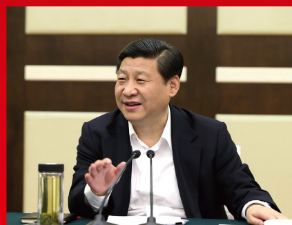
2012 年 12 月 7 日至 11 日，习近平总书记在广东省考察工作时强调，改革开放是当代中国发展进步的活力之源，是我们党和人民大踏步赶上时代前进步伐的重要法宝，是坚持和发展中国特色社会主义的必由之路。图为 2012 年 12 月 9 日，习近平总书记在广州市主持召开经济工作座谈会时发表讲话。