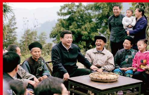
2013 年 11 月，习近平总书记在湖南省湘西、长沙等地考察，明确提出“精准扶贫”理念。2015 年 11 月，习近平总书记在中央扶贫开发工作会议上强调，要坚决打赢脱贫攻坚战，确保到 2020 年所有贫困地区和贫困人口一道迈入全面小康社会。图为 2013 年 11 月 3 日，习近平总书记在湖南省湘西土家族苗族自治州花垣县排碧乡十八洞村同村民座谈。