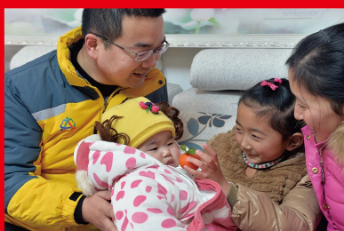
2013 年 12 月 21 日，中共中央、国务院印发《关于调整完善生育政策的意见》，提出单独两孩的政策。2016 年 1 月 1 日，修改后的《中华人民共和国人口与计划生育法》正式实施，明确国家提倡一对夫妻生育两个子女。图为江苏省洪泽县的一家四口。