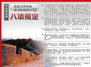
2012 年 12 月 4 日，中共中央政治局会议审议通过《十八届中央政治局关于改进工作作风、密切联系群众的八项规定》。11 日，中共中央印发这一规定，这是党的十八大召开以后制定的第一部重要党内法规。以习近平同志为核心的党中央以身作则，率先垂范，严格执行八项规定，各地区各部门陆续制定相应规定、细则并严格贯彻落实中央八项规定精神。