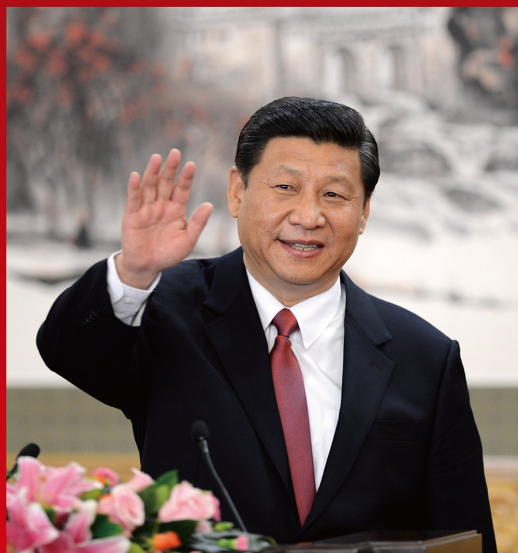
2012 年 11 月 8 日至 14 日，中国共产党第十八次全国代表大会在北京举行。11 月 15 日，党的十八届一中全会选举习近平为中央委员会总书记，决定习近平为中央军事委员会主席。