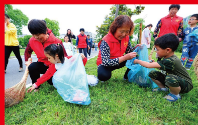
2012 年 11 月，党的十八大提出社会主义核心价值观。广泛采用理论阐释、新闻宣传、文艺作品、网上传播等多种形式，使社会主义核心价值观浸润于社会生活方方面面，成为人们“日用而不觉的行为准则”。图为群众以实际行动践行社会主义核心价值观。