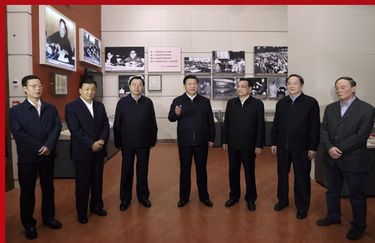
2012 年 11 月 29 日，习近平总书记和中共中央政治局常委参观《复兴之路》展览。习近平总书记提出“中国梦”，强调实现中华民族伟大复兴，就是中华民族近代以来最伟大的梦想；现在，我们比历史上任何时期都更接近中华民族伟大复兴的目标，比历史上任何时期都更有信心、有能力实现这个目标。