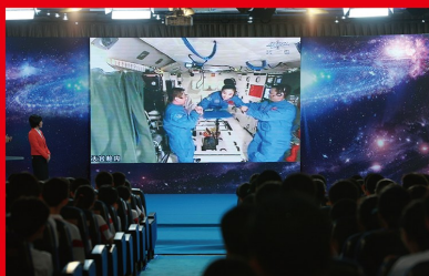
2013 年 6 月 11 日至 26 日，搭载着聂海胜、张晓光、王亚平 3 位航天员的神舟十号载人飞船成功发射并顺利返回着陆。在轨飞行期间，神舟十号与天宫一号目标飞行器成功进行自动和手控交会对接，并首次开展中国航天员太空授课活动。