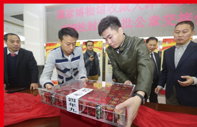
2013 年 4 月 24 日，国务院常务会议决定第一批先行取消和下放 71 项行政审批事项。至 2017 年 9 月，国务院部门取消和下放行政审批事项的比例超过 40%；非行政许可审批彻底终结；清理规范国务院部门行政审批中介服务事项超过 70%。图为 2014 年 11 月 15 日，国家博物馆工作人员搬走天津滨海新区 109 枚封存行政审批卡。