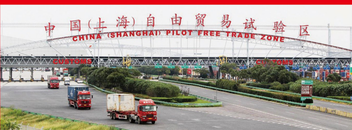
自 2013 年起，中国陆续在上海、广东、辽宁、海南等 12 个省市设立了自由贸易试验区。图为上海自由贸易试验区。