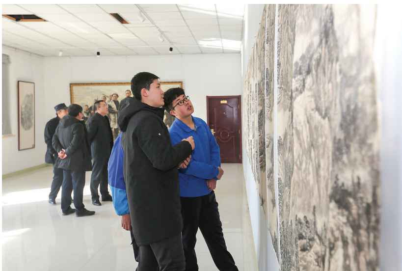
越来越多的年轻人被画作所吸引