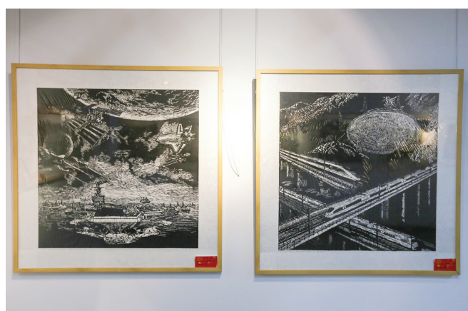
用画笔描绘改革开放四十周年的巨变