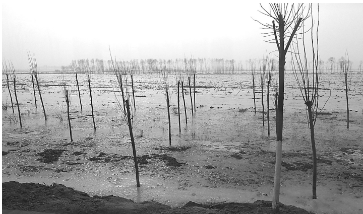
肖家庄镇冬浇后的耕地场景

本报讯(记者 曹永亮 通讯员 崔爱荣)今年春播,汾阳市肖家庄镇农民不用发愁,因为2018年该镇共冬浇耕地四万余亩。