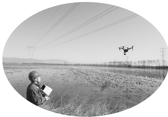
无人机巡查线路现场

本报讯(记者 李艳 通讯员 任海鹏)巡查线路遇农耕浇地,想对策无人机来帮忙。近日,国网吕梁供电公司输电运检室(汾阳)运维二班无人机组开展无人机巡查工作,此次巡查主要针对位于农耕浇地区域的杆塔与线路,巡检效果良好,通过审查航拍照片和视频,及时掌握了这些杆塔的实时“健康”状态,为此后检修工作做好了“勘察任务”。