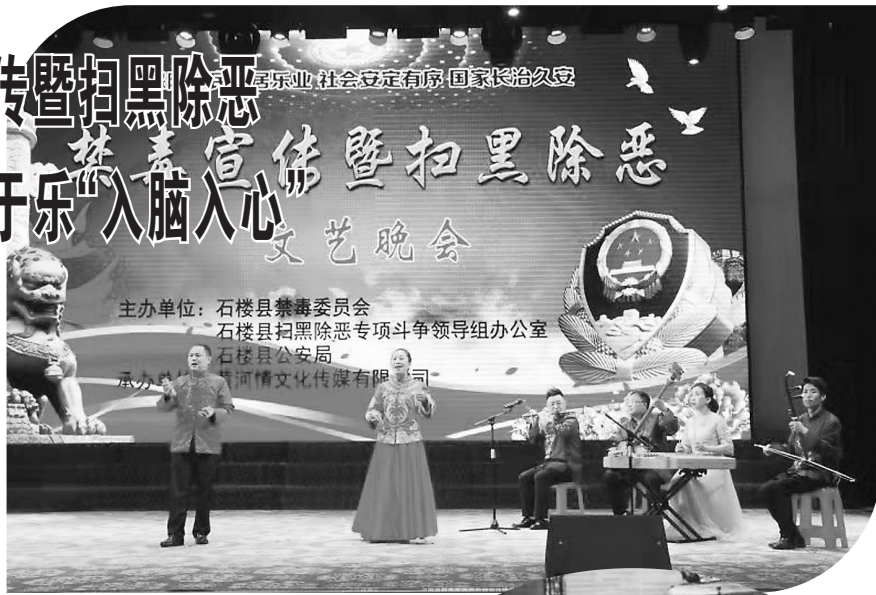
三弦书《马家军覆灭记》

据悉,此次文艺晚会着力于贯彻学习习近平总书记在全国公安工作会议上的讲话精神,以禁毒、扫黑除恶宣传为主线,紧扣时代脉搏,融警示、宣传、教育、娱乐为一体,在寓教于乐中弘扬了社会正气,激发了全县人民广泛参与扫黑除恶专项斗争和禁毒人民战争的热情。