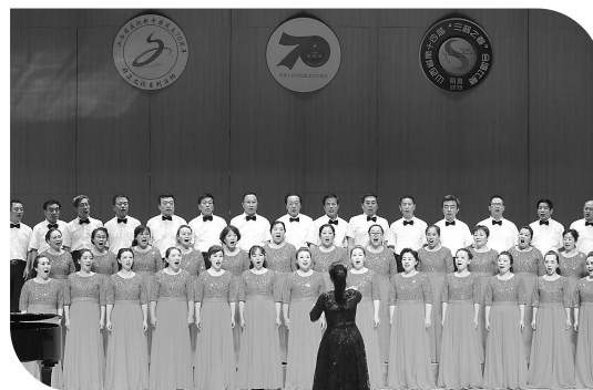
孝河之声合唱团演出场景

据了解,汾阳市将继续推进文化振兴工程,深化文化体制改革,提高基础设施建设和公共文化服务水平。推进文化惠民、文艺精品创作、乡村民俗文化生态保护和乡村记忆等工程,加大非物质文化遗产的挖掘、保护与转化,开展免费送戏下乡文化惠民活动。同时,加强文化市场监管,确保文化市场繁荣稳定,努力打造市民满意、人才向往、游客点赞、投资者称道的城市。