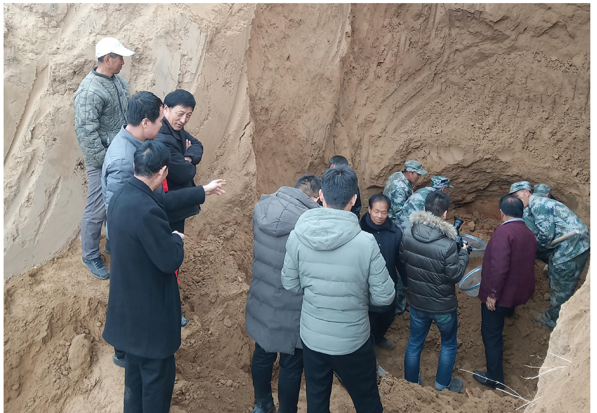
图为寻找挖掘烈士遗骸现场。