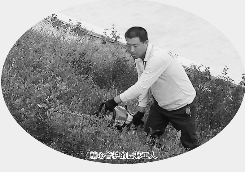
精心管护的园林工人

人工湖、亭台楼阁、小桥流水、假山绿地、声光喷泉……炎炎夏日,一座崭新的城市公园——蔚汾公园,成为在兴县新城区的一道亮丽风景线,成为市民群众休闲纳凉的好去处。