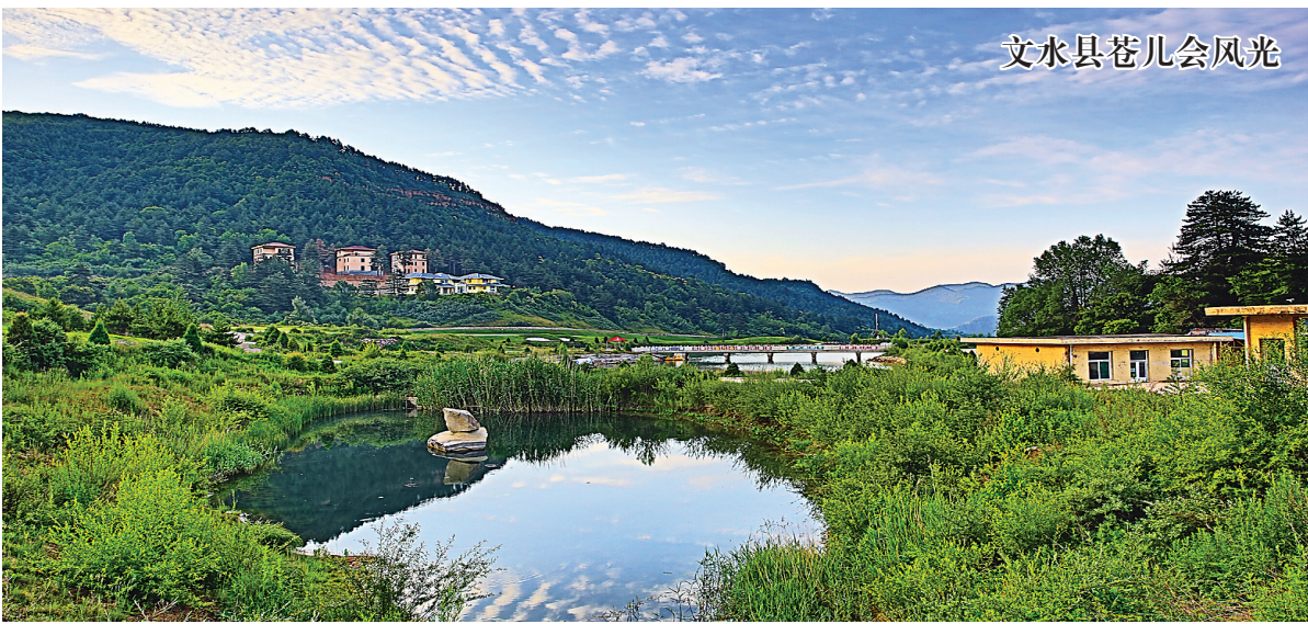
文水县苍儿会风光