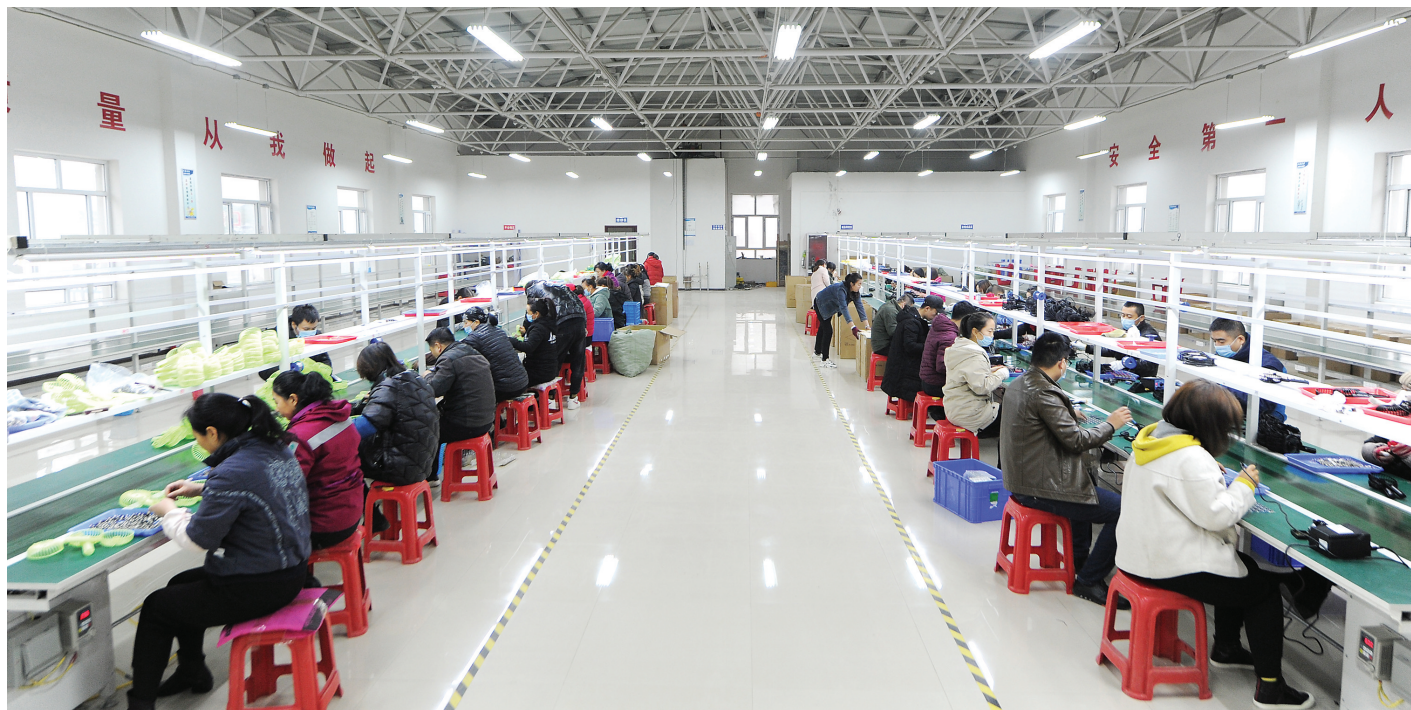
11月29日,在临县水安苑易地移民安置点的“扶贫车间”内,工人正在加工小风扇等快消小家电。近年来,我市在做好易地扶贫搬迁入住工作的同时,不断完善搬迁群众就业后续扶持工作,拓展群众增收渠道,努力让搬迁群众“搬得出、稳得住、能致富”。目前,临县水安苑易地移民安置点1800㎡的电子产品组件安装车间已经开始试产,搬迁户实现了“家门口”就业的生活愿景。

会议还研究讨论了《市委常委会“不忘初心、牢记使命”主题教育专题民主生活会检视剖析材料》,要求把开好专题民主生活会作为开展主题教育的重要内容,严格按照中央和省委要求,盘点收获,检视问题,深刻剖析,明确整改,确保开出高质量专题民主生活会。