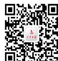
吕梁日报微信公众号